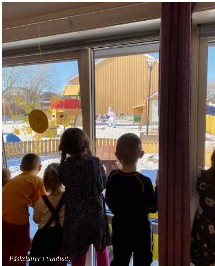
Påskeharer i vinduet.