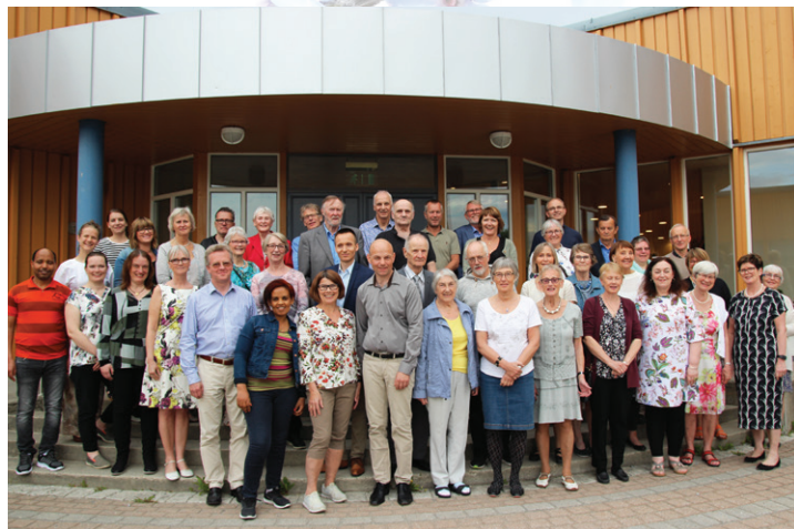
Vårfest i Rønvik kirke.