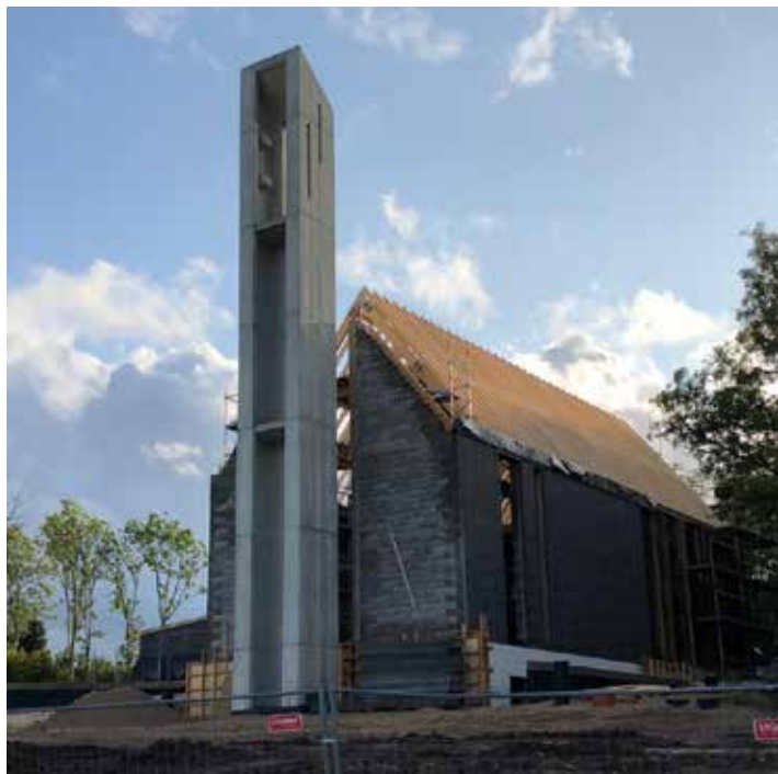
Den nye kirka i Saku utenfor Tallin

Fram til 1940 ble den lutherske kirken regnet som den tradisjonelle folkekirken i Estland. Etter 50 år med kommunisme, regnes landet nå som et av de minst religiøse i Europa. NMS samarbeider med Den estiske evangelisk-lutherske kirke (EELK) om å være med å bygge levedyktige menigheter og skape nye møteplasser. I tillegg støtter de barne- og ungdomsarbeidet i kirken. NMS har både misjonærer og praktikanter i Estland.