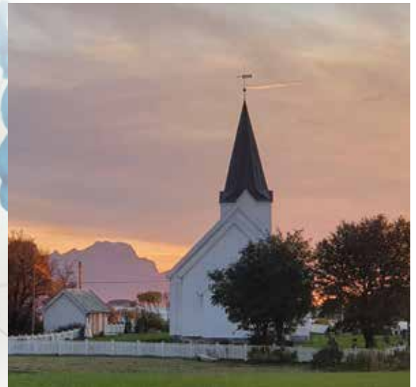
Kjerringøy kirke.