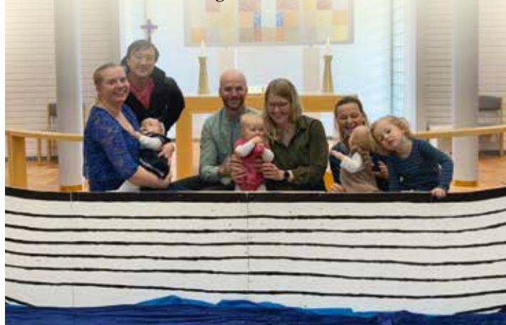
Fint å være i båten med Jesus når det stormer.

Vi starter opp med tirsdagsmiddag for barn og deres familier tirsdag 8. mars.