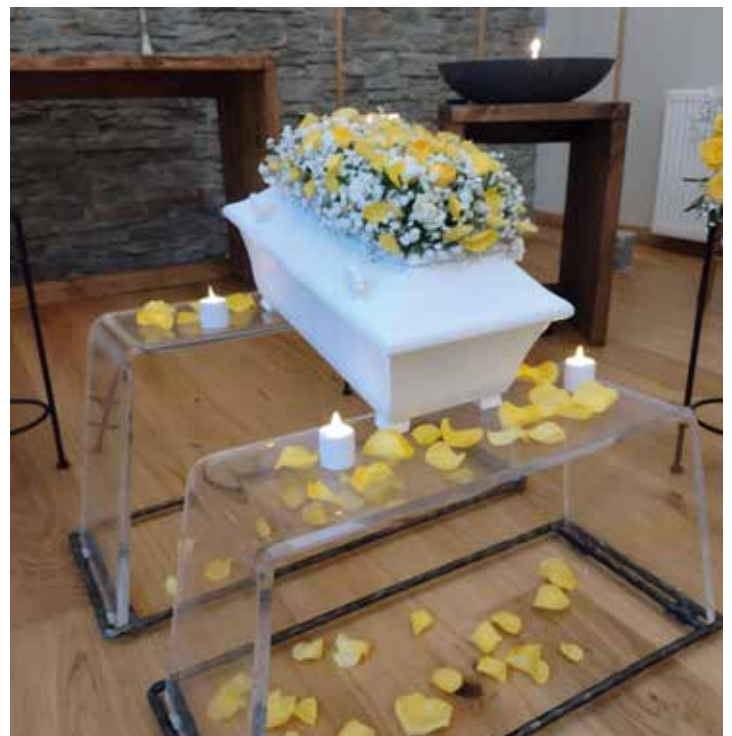
Fra en barnebegavelse

- Etter hvert begynte jeg å snakke med foreldrene om de ønsket en egen begravelse for det døde barnet. Jeg husker vi hadde begravelser helt ned til 18 uker gamle nyfødte. Dette var nytt for mange. Selv om foreldrene ikke ønsket en begravelse, fikk alle de små etter hvert en egen grav. Graven ble registrert og foreldrene kunne oppsøke graven senere. Jeg jobbet ikke i helgene, så de som fikk døde barn da måtte vente til jeg kom på jobb uka etter. Jeg forsto snart at alle jordmødrene burde læres opp til å samtale med foreldrene om dette. Vi lagde etter hvert rutiner for hva vi skulle gjøre i slike situasjoner, og vi ønsket at jordmora som tok imot barnet, skulle følge opp. En prest i Bodø eller i distriktet ble kontaktet, og familien fikk en grav å gå til.