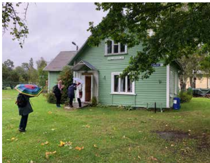
Den gamle kirka i Saku

Saku er et tettsted utenfor Tallinn. I 2011 startet NMS og EELK et menighetsplanteprosjekt her. Resultatet ble Saku St. Thomas menighet, som i 2020 hadde cirka 130 medlemmer. Menigheten driver blant annet søndagsskole, babysang, fotballgruppe, gospelkor, ungdomsarbeid og konfirmant- og bibelgrupper. For lokalmiljøet arrangeres familiedager og ski- og markedsdager. Nå er de med på å bygge et sakralt og moderne kirkebygg, det første med solcellepanel på taket i denne delen av Europa.