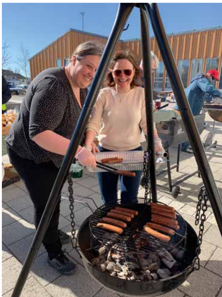
Konfirmantforeldre griller pølser.