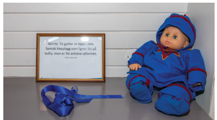
Kafka, samisk dåpsdrakt.