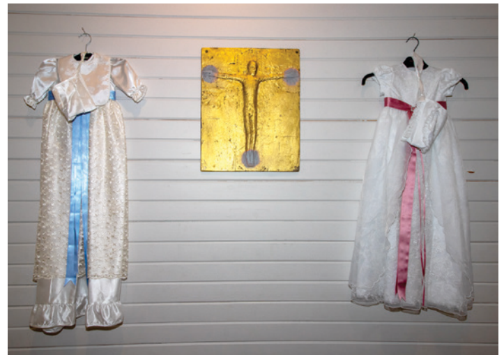
Dåpskjole til gutt og jente.

Rønvik kirke ønsker å ha en dåpskjole her i kirka som kan lånes ut, om noen trenger. Ta gjerne kontakt om du kan bidra.