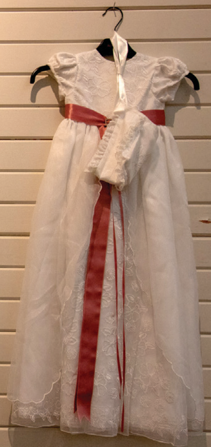
Fra dåpskjoleutstilling i Rønvik