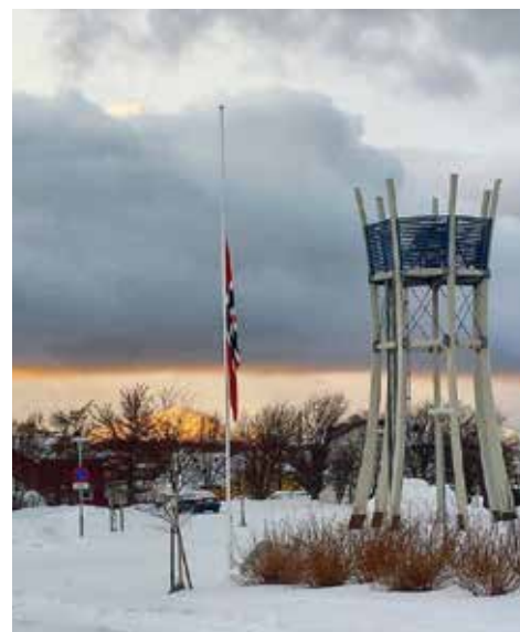
Begravelse i Rønvik kirke.