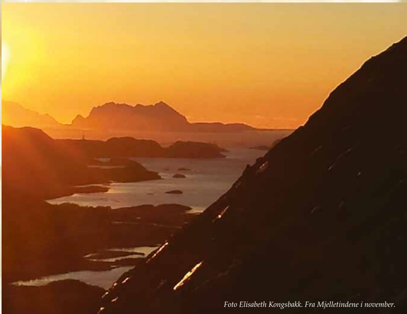
Fra Mjelleindene i november.