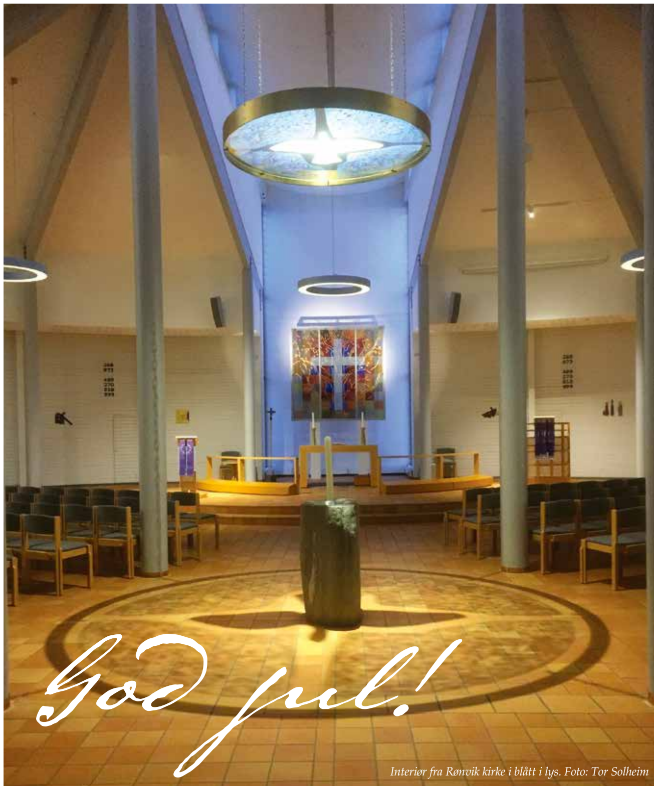
Interior fra Rønvik kirke i blått i lys.