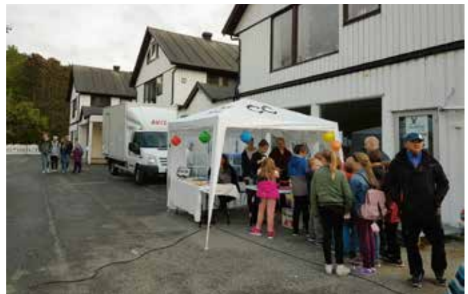
CC stand på FØRSOMMER.

ha sumobryting i år også, men været passet dessverre ikke. Men heldigvis hadde vi skaffet oss et telt der vi kunne ha stand og selge sukkerspinn. Ungdommene fra Church Chill var aktiv med å hjelpe å selge sukkerspinn. Det tok litt tid å lage sukkerspinn, men ellers var kvelden vellykket.