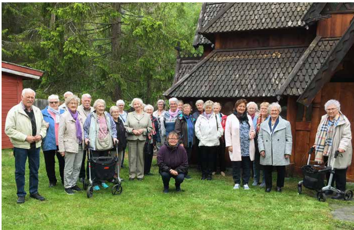
Hele gjengen ved Stavkirka.