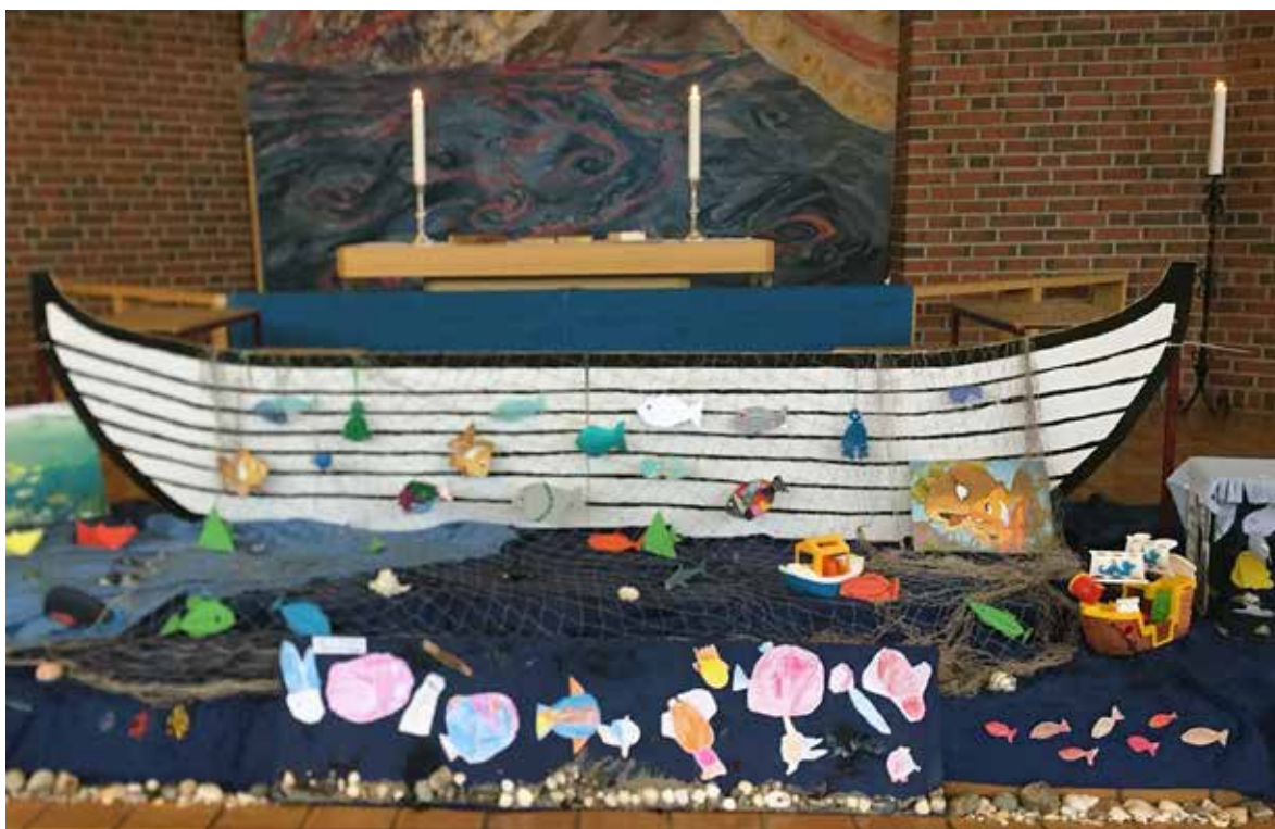
Fra sommersamling med barnehagene i juni. Temaet var fisk, og vi snakket om forsøpling og livet i havet.

I tillegg til deres bevissthet om behovet for renslighet og resirkulering, viser japanerne stolthet over levesettet deres ved å rydde under arrangementer som VM. De deler det med resten av oss, sier North til BBC.»