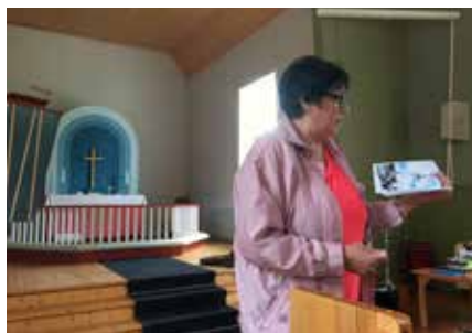
Inne i Høyformoen kapell.

Første stopp var på Ysteriet i Misvær hvor vi fikk servert vafler, kaffe og sjokoladeboller. Her fikk vi også høre om historien om Ysteriet og Misværosten.