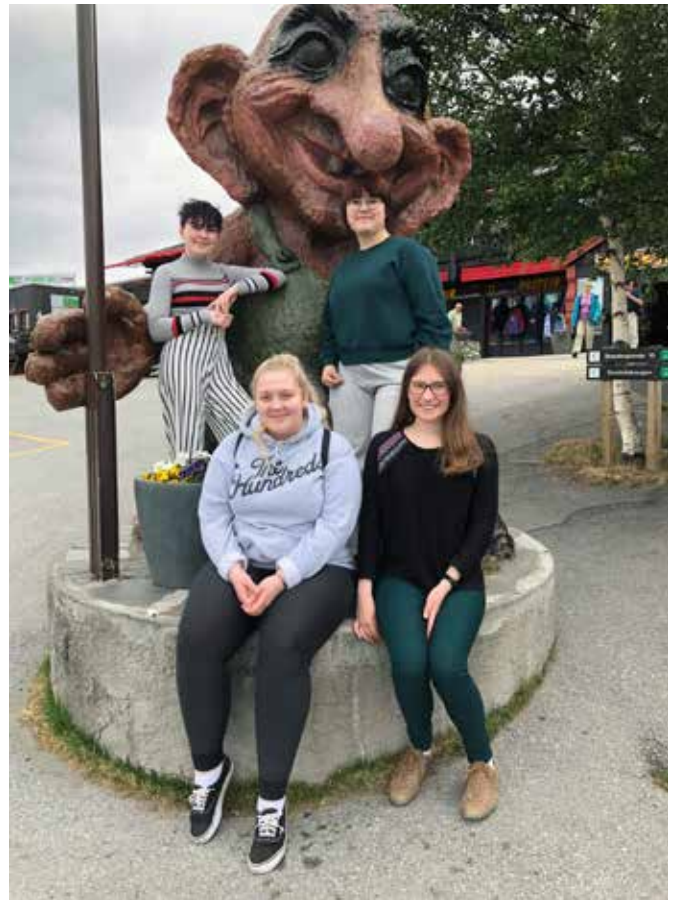
På vei til Ten Sing-seminar.