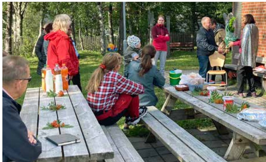
Avskjed i solveggen.