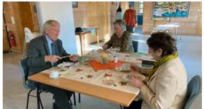
Deltakerne på seniorsøndagen.