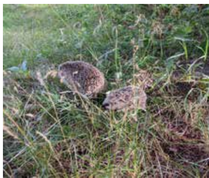
Gjester i barnehagen.

Siden mars har barnehagen som alle andre i hele verden opplevd en merkelig tid. Tida med nedstenging benytta vi ansatte til storrydding og vask, digitale samlingsstunder og vi besøkte ungene på trappa med god avstand. Da vi kunne åpne