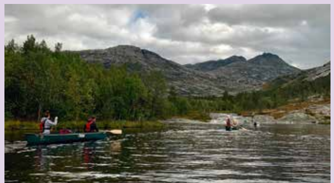
Fra friluftsturen.