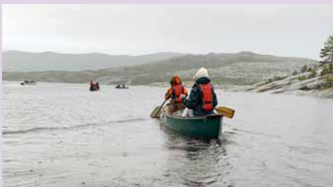
Fra friluftsturen.