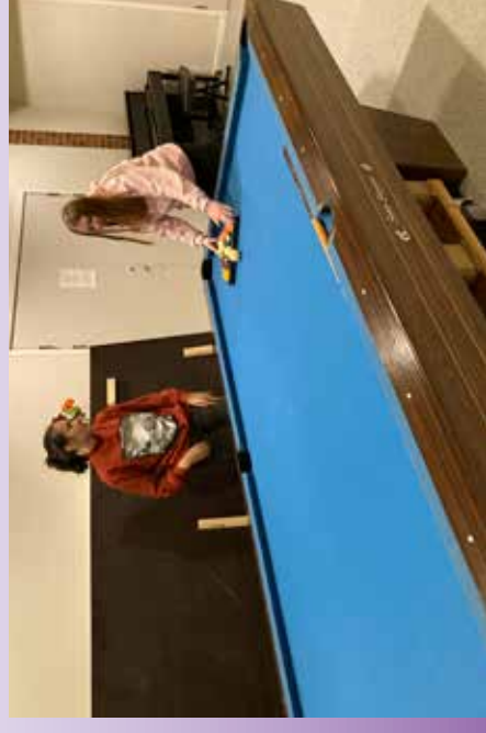
Det nye billiardbordet ble innviet på CC 23. oktober.