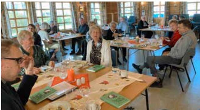
Deltakerne på seniorsøndagen.

Til dessert fikk vi eplekake med is og kaffe. Vi avsluttet med «Fager kveldssol smiler». Stor takk til damene i Seniorutvalget for god servering og så er vi glade for at vi fikk til et arrangement for denne gruppen til tross for Korona.