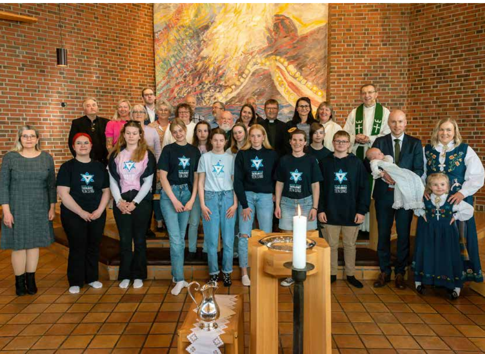
Medvirkende på avslutningsfesten for soknepresten.