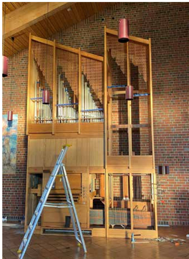
Orgelet før flytting.

Nå har koraktivitetene fått god plass på venstre side, både for instrumentene sine, men også for oppstilling ved deltakelse i gudstjenester og konserter. Estetisk passer orgelet mye bedre inn i kirkerommet der det nå står etter flytting, ettersom skråtaket i kirken faller elt parallelt med orgelets topp.