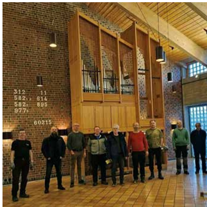
Flyttemannskapet foran orgelet etter vel utført arbeid.