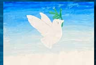
Elevarbeid fra Tverlandet og Saltstraumen skole til jul med tema «Fred».