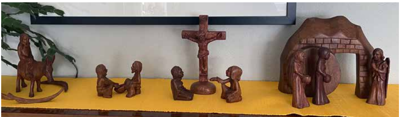
Påskefortellingen med figurer fra NMS.

Å, salige stund uten like, Han lever, han lever ennu! Han vandrer i seierens rike, Min sjel, hvorfor sørger da du? Du søkte din trøst i den døde, Og dvelte ved gravnatten kun, Så fikk du ham levende møte, Å, salige, salige stund!