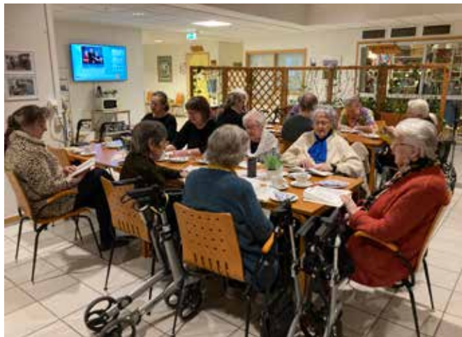
Noen av tilhørerne.

Gerd-Anita hadde andakt og konfirmantene hjalp til med åreslag og å dele ut gevinster. Vi koste oss med