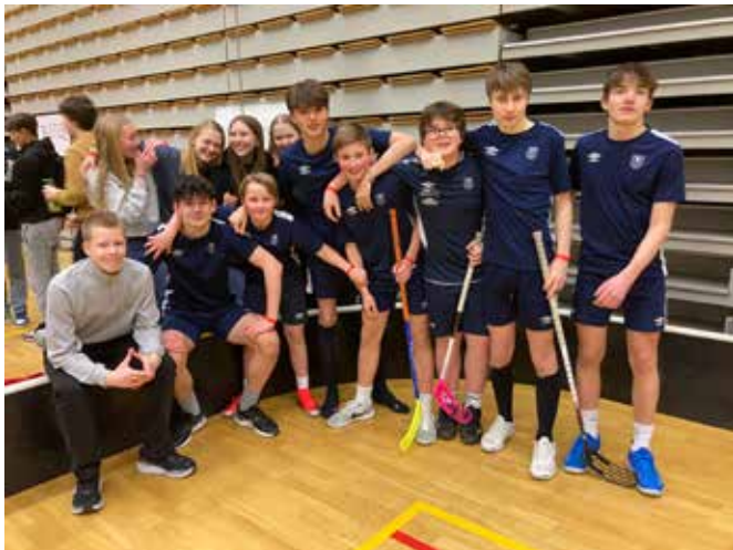
Vårt innebandylag vant turneringen på Bynatt.