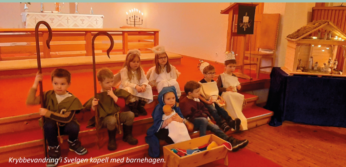
Krybbevandring i Svelgen kapell med barnehagen.