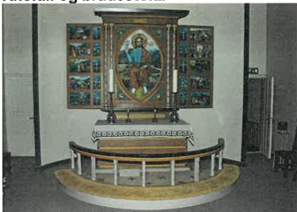
Bilde av altar med knefall/altaring.