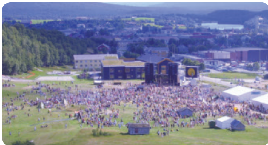
Her er mange av speiderne samlet til misjonsmarked.

Nå syns vi det er på tide at speiderne i kirken får vist seg frem litt, så fremover vil vi prøve å sende noen ord til Menighetsbladet.