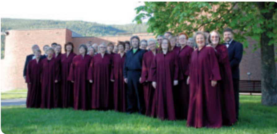
Kongsberg Kantori ved Åssiden kirke.

Torsdag kveld kunne de som fant veien til Åssiden kirke nyte korsang på høyt nivå. Medlemmer av Kongsberg Kantori framførte deler av det programmet de skal synge under et kommende besøk i Tyskland og det var en nytelse å være tilhører til deres eminente sang.