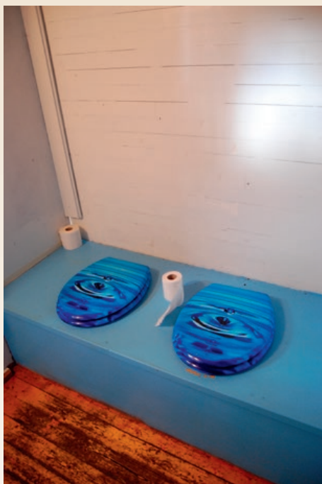
Se denne fancy utedoen!