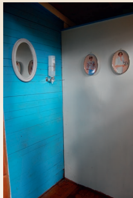
Lekre bilder på doveggen