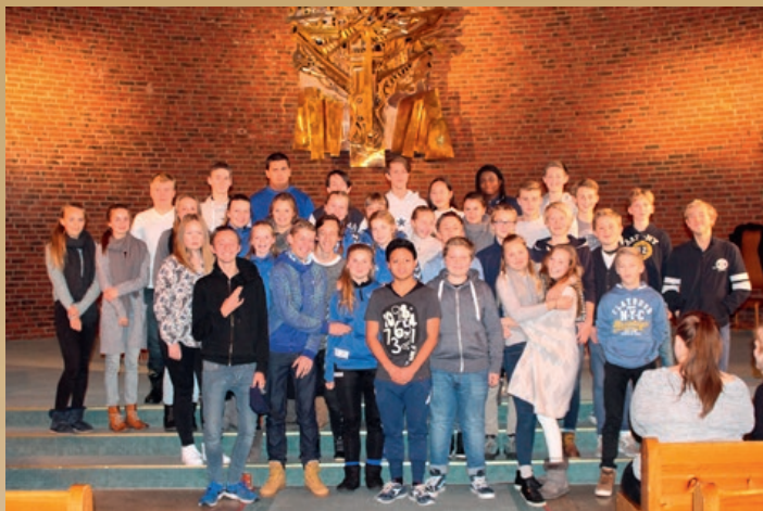
En artig gjeng på sin første samling som konfirmanter