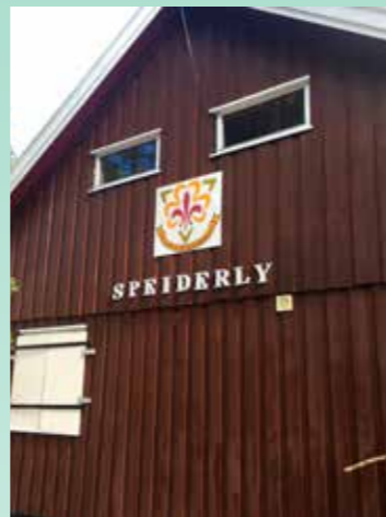
Nytt logo møter besøkende til Speiderly.