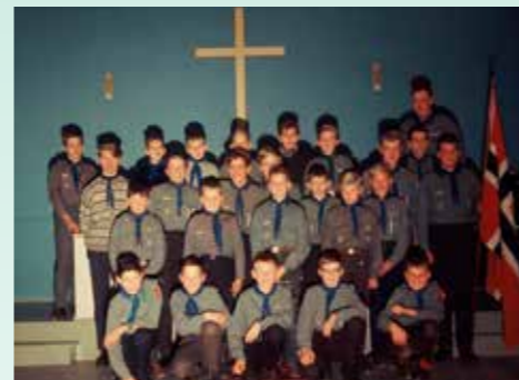
Tropen samlet på Zoar Bedehus i 1964. Mange kjente fjes.