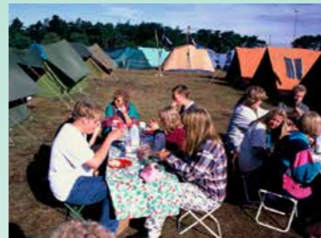
Sommerleir i Nottingham, England i 1993. Frokost i Sherwood skogen.