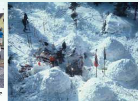
Det ble mange påskeleir i iglo på Blefjell. Her fra en leir i 1962.