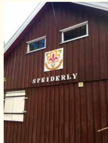
Nytt logo møter besøkende til Speiderly.

Alle møter er vanligvis i Speiderrommet, underetasjen i Kirken. For ytterligere info, ta kontakt i tlf. 91629302 eller på mail: runar@drammenkm.com