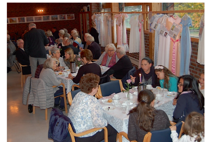
Kirkekaffen 1. oktober 2017

Ta gjerne kontakt med en fra kirkens stab hvis du er interessert i forhåndsbestilling!