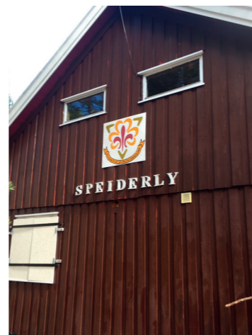
Nytt logo møter besøkende til Speiderly.