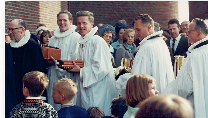
Innvielsen 1. oktober 1967.

I anledning feiringen av Åssiden kirkes 50-årsjubileum i 2017, vil det bli utgitt et jubileumshefte høsten 2018 .