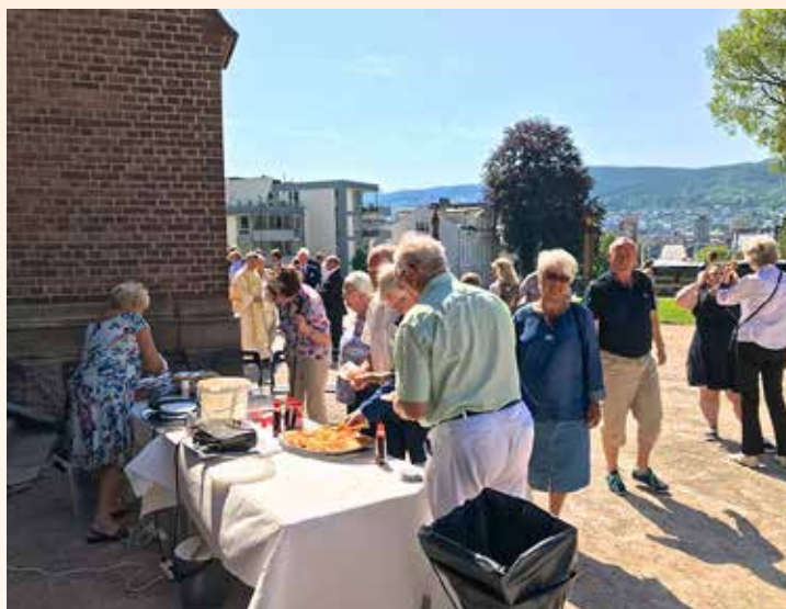
Guttekoret fra Nøtterøy sang høymesse i Bragernes kirke. Sjømannskirken deltok også og det var vafler på kirkebakken