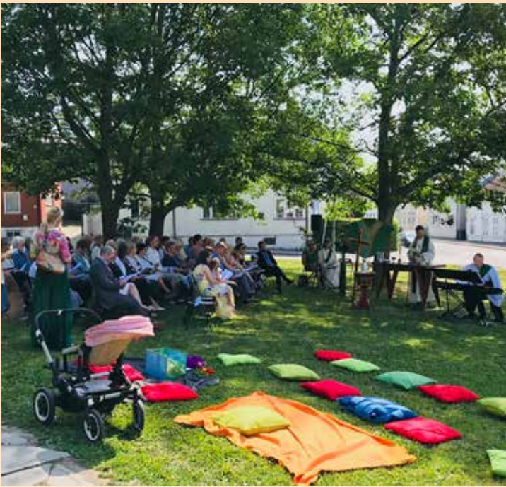
Friluftsmesse med dåp på Skaperverkets dag