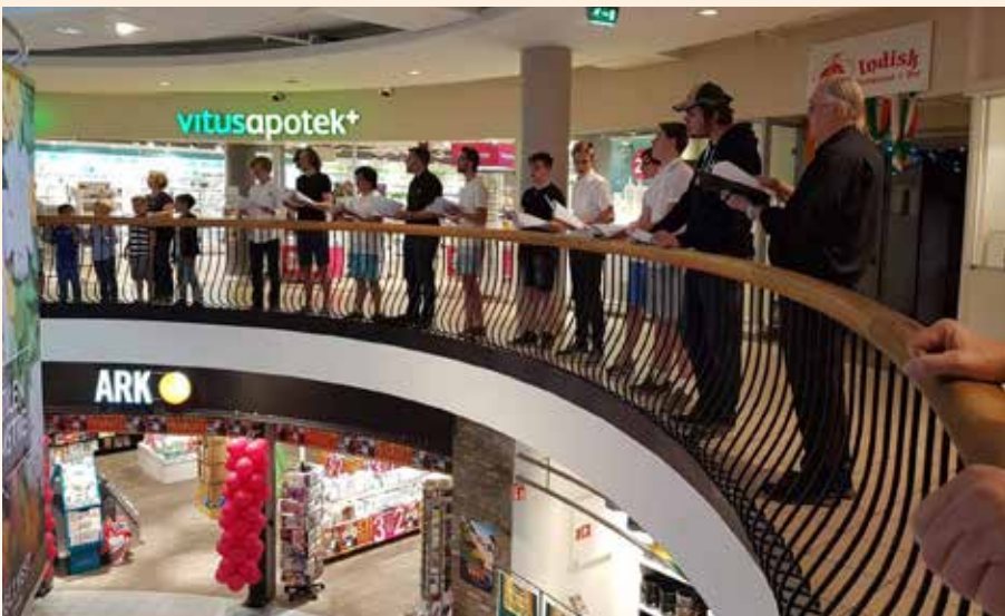
Guttekoret sang minikonsert på Torget vest