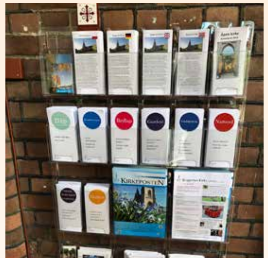
Ta gjerne en titt på våre nye temabrosjyrer, som du finner i våpenhuset i kirken