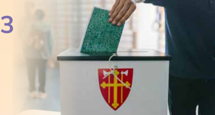
Din stemme er med på å bevare Den norske kirke som landets største demokratiske medlemsorganisasjon.