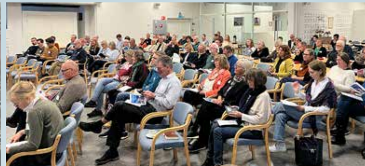
Mikkelsmesskonferansen ble holdt for andre gang i Bragernes kirke og menighetshus. Denne gangen med fokus på gravferd.