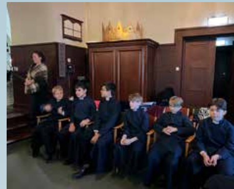
Guttekoret på forestillingen Jenta og djevelen i Lovisenberg kirke.