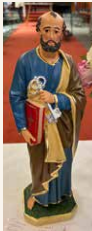
Gaven fra Great Totham.