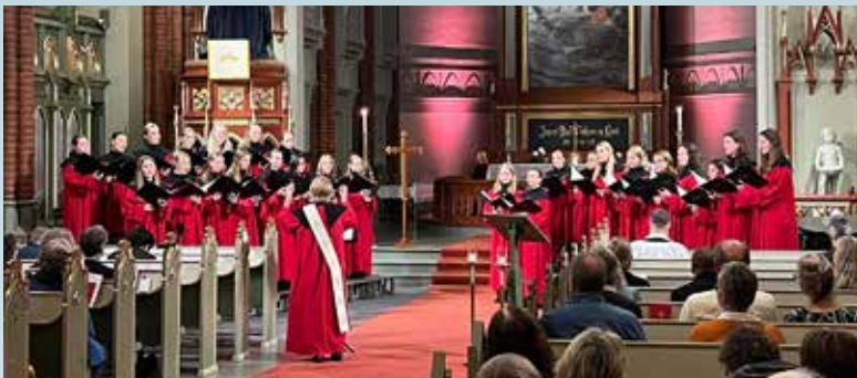
Evensong med urframføring av «Bragernes Canticles» av Kim André Arnesen.