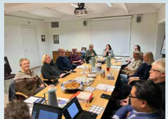
Konstituerende møte for nytt menighetsråd.