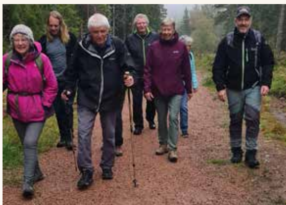
På tur til sportskapellet.