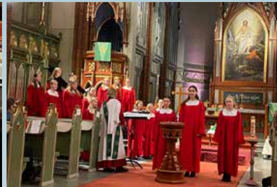
Jentekoret synger i familiemesse.