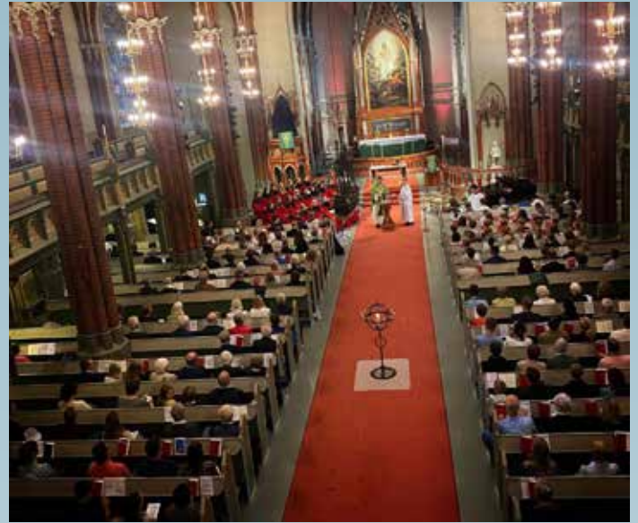
Hyggelig med mye folk på høymessene og familiemessene.