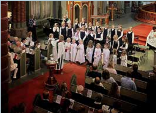
Aspirantene og Minores synger på familiemesse.