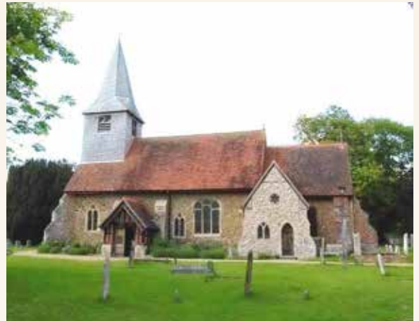
St. Peter's church.