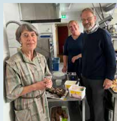
Det gjøres klart til kirkekaffe.