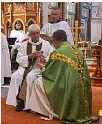
Fra høymessen under besøket.