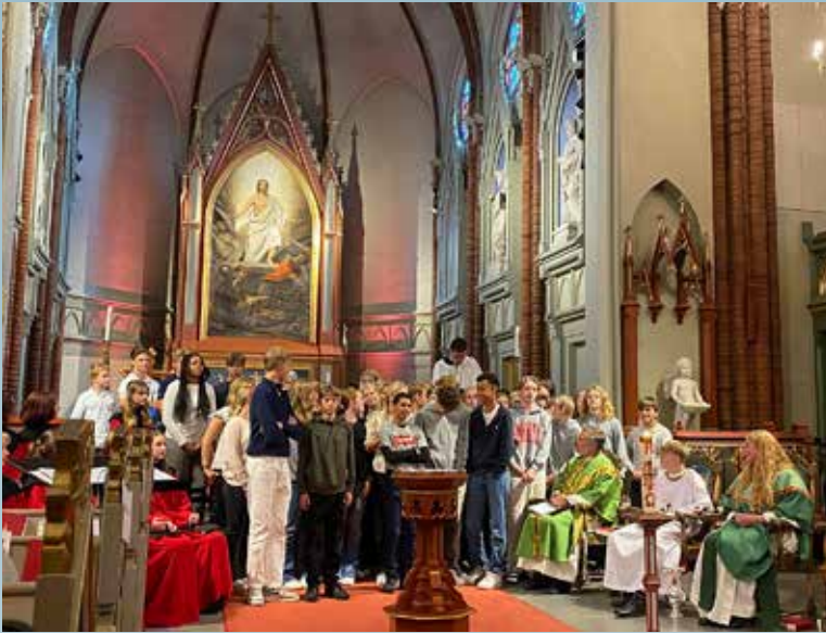
Presentasjon av menighetens konfirmanter.