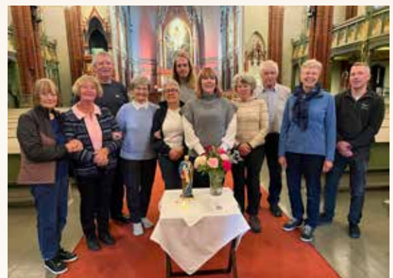
Før hjemreisen til England.