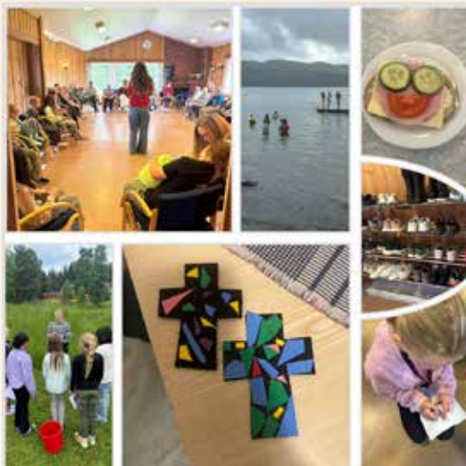
Agentleir på Solsetra.