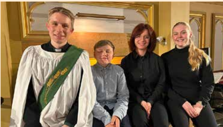
Orgelelever spilte høymesse.