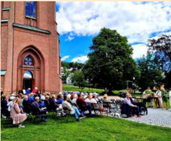
Friluftsmesse på Skaperverkets dag.