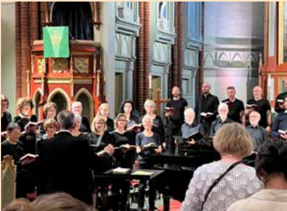
Kulturnatt. Sing-a-long med Bragernes Kantori.