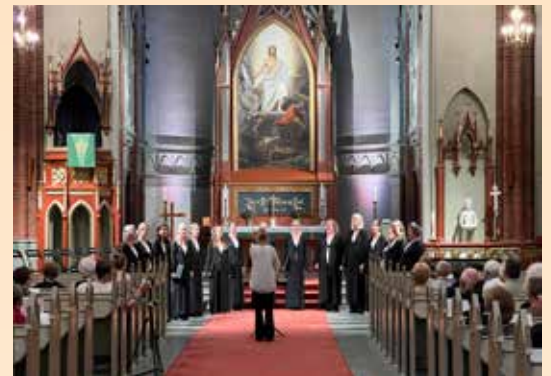
En av mange konserter i Bragernes kirke under Kulturnatt Drammen.