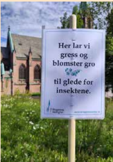
Glimt fra Kirkeparken.