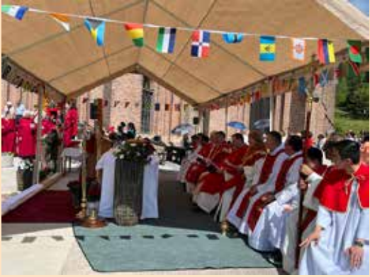
Internasjonal pinsefeiring sammen med St. Laurentius katolske menighet.