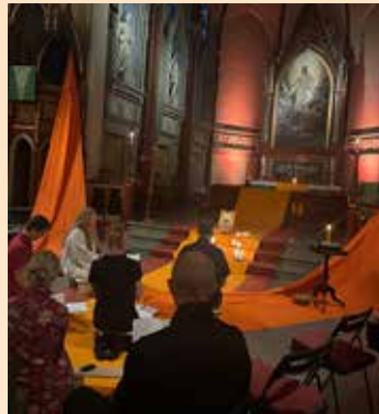
Taizé-kveldsbønn som avslutning på Kulturnatt.