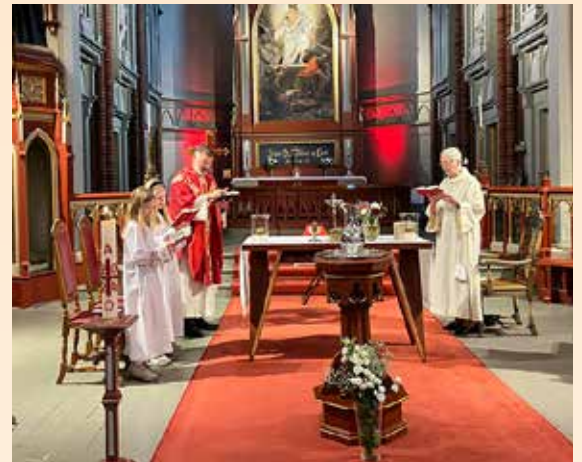
Glimt fra en av sommerens mange høymesser.