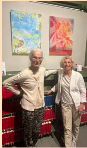
Utstillingen «Lys» med utvalgte verker av Inara Dzelzs.