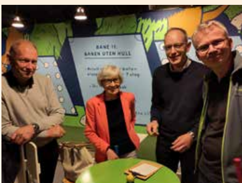
Staben forsøker seg på minigolf.