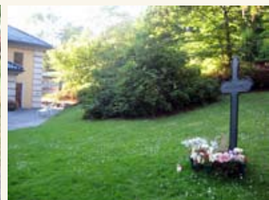
Gravminne ved krematoriet for anonymt gravlagte.