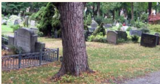
Bragernes øvre kirkegård.