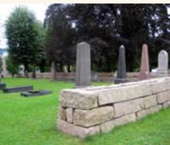
Bragernes nedre kirkegård.

Bragernes kirkegård har også et annet navn, "Bragernes øvre kirkegård"; dette tilsier at det også finnes en "Bragernes nedre kirkegård". Denne befinner seg ved Losjeplassen, i det som betegnende nok kalles Kirkegårdsparken. Denne kirkegården ble anlagt i 1853 med tanke på koleraepidemier, som herjet nedover i Europa på den tiden. Siste gang kirkegården var i bruk var i 1952. Nå er området blitt park, men fortsatt står det noen gravstøtter i det ene hjørnet, som minner om fordums bruk av området.