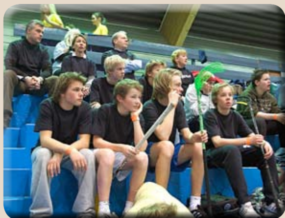
«Bragernesbenken» med de voksne bakerst.