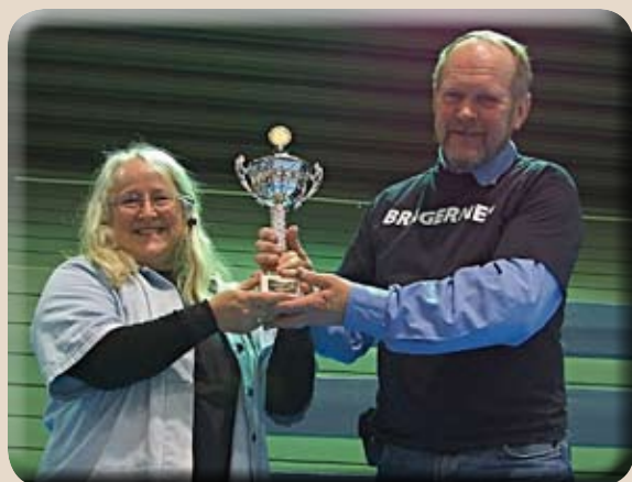
Stolte konfirmantledere med pokalen for seier i innebandyturneringen.

Bragernes menighet stilte mannsterkt i årets nattcup for konfirmanter. Sammen med et nesten fulltallig konfirmantkull stilte konfirmantledere fra staben, foreldre og representanter fra menighetsrådet. Nattcupen er en idrettsturnering der fotball, håndball og innebandy står på programmet. Turneringen pågikk fra fredag kveld kl. 23 til lørdag morgen nærmere kl. 8. Denne gang deltok konfirmanter fra Drammen, Lier, Røyken og Hurum. Bragernes stilte lag i alle idrettene. De som ikke spilte, deltok som supportere. Natten ble nok lang for noen, men det skjedde noe stort sett hele tiden slik at man ikke fikk tid til å kjede seg noe særlig.