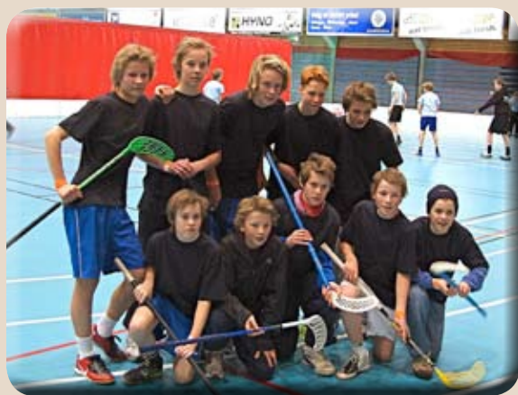
Vinnerlaget i innebandy som imponerte med godt spill og sterk lagmoral!