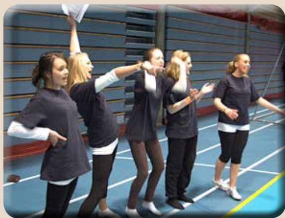
Også supporterne gjorde en god innsats!