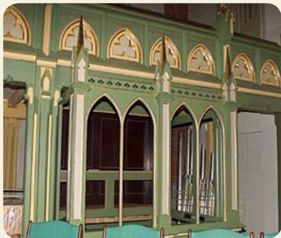
Kororgelet blir plassert lengst framme under galleriet mot vest. Som bildet viser, er fasaden fint tilpasset kirkens arkitektur.