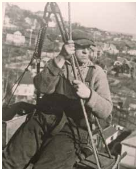
En av gutta heiser seg opp i tårnet med hjelp av tau og taljer.

Tre akrobater på toppen av kirkespiret. En arbeidsplass med fantastisk utsikt ut over byen.