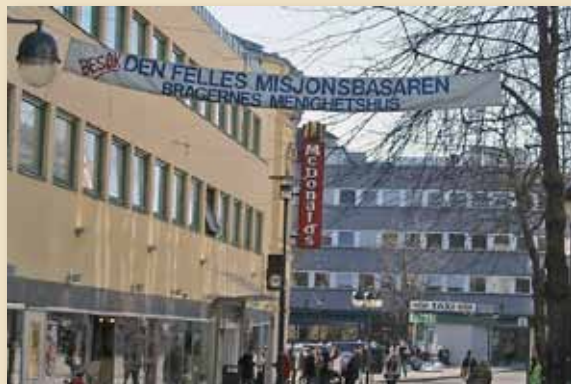
Basaren ble markert i gågaten.