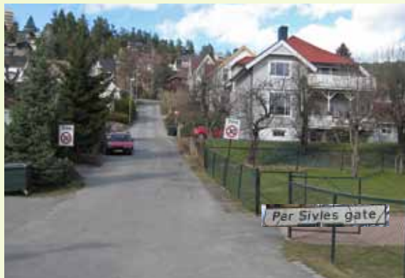
Per Sivles gate er en liten tverrgate mellom Hotvetveien og Øvre Storgate – omtrent ved huset han bodde i.