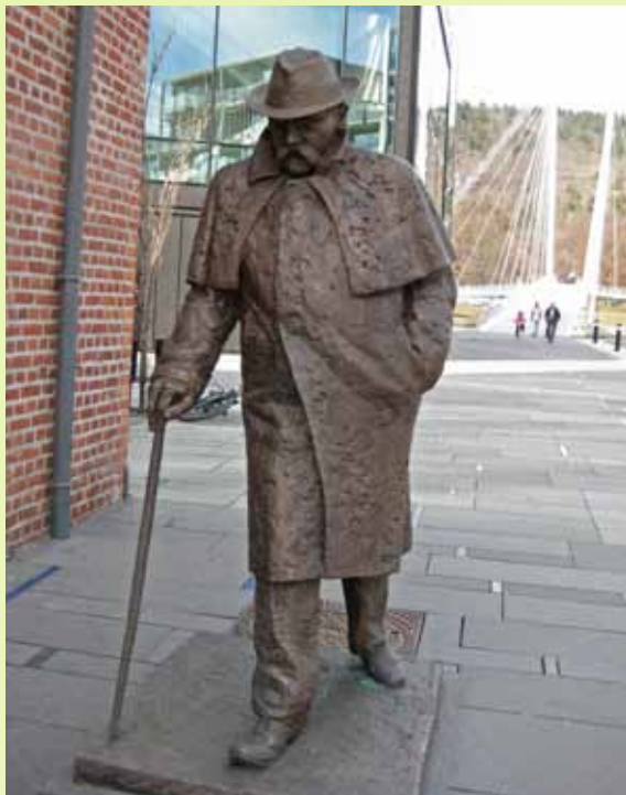
Per Sivle «i farten». Papirbredden og Ypsilon i bakgrunnen.

Har du sett den nye gatestatuen av Per Sivle? Med bestemte skritt og flagrende frakk ser det ut som han kommer spaserende fra Bragernes over Ypsilon. Det er kunstneren Merete Sejersted Bødtker som har laget skulpturen av den landskjente arbeiderdikteren. Statuen ble avduket 8. april, og drammenene ser ut til å være begeistret både for plassering og utførelse. Forfatteren, lyrikeren og journalisten Per Sivle har fått en meningsfull plass på fortauet utenfor biblioteket på Papirbredden. Blant bøker og rester etter de gamle arbeiderbygningene i Drammen ville han trivdes.