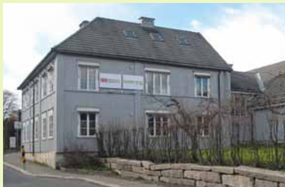
Per Sivle bodde de siste årene av sitt liv i Øvre Storgate 92

Per Sivle bodde halve livet i Drammen etter at faren kjøpte gården Langum like ved grensen til byen. Han levde og jobbet i byen med kone og barn. Han skrev og hadde opplesninger. I ungdommen hendte det også at han sto på Bragernes Torv og solgte dikt. Han ga ut 15 bøker i ulike sjangere. Romanen Streik fra 1891 handlet om en konflikt på et sagbruk i Drammen. Selv om han er mest kjent som forfatter og arbeiderdikter,