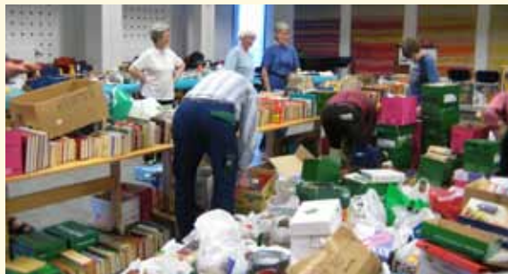
Det var ikke få kasser med bøker som ble båret opp og pakket ut dagen før loppemarkedet.