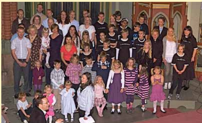
Kor fra Norkirken

Kor fra Norkirken deltok med fin og livlig sang, og det var hilsen fra Norkirken i Drammen. Det historisk nære forholdet mellom Bragernes menighet og Drammen Indremisjon ble understreket.