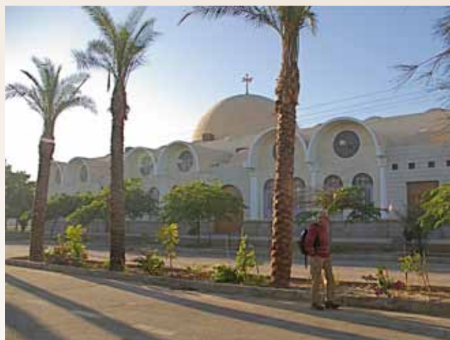
Den koptiske kirkens hovedkvarter i Naqada. Besøkende blir innkvartert i små leiligheter på området. Bildet er fra 2007 da en gruppe fra Bragernes besøkte Egypt.

Fredag 24.9: Avreise til Sverige, der de skal besøke koptiske menigheter.