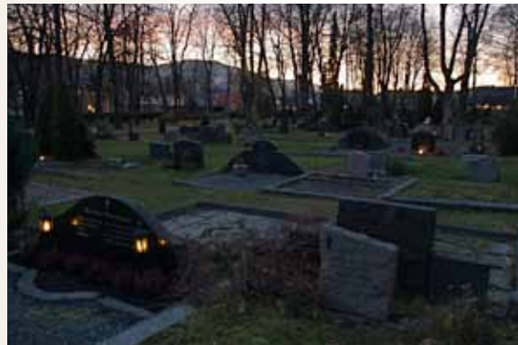
Allehelgensdag på Bragernes kirkegård.

Børn under 15 år straffes med Riis på Rådstuen. – Drammen 1850