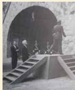
Kong Olav setter sitt navntrekk på en steinplate ved inngangen til Spiralen ved 100-årsjubiléet i 1961.

Så gjenstår det å se om feiringen av 200-årsjubiléet i 2011 vil sette varige spor i byen vår.