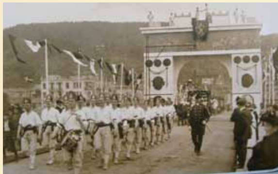
Historisk opptog over bybroen – Byjubileet 1911.

Den 19. juni 1911 var det 100 år siden ladestedene Bragernes og Strømsø-Tangen ble forenet til en by; Drammen. Med 25 kanonskudd fra Brannposten, mandag morgen den 19. juni, var byen klar for feiring av 100 års jubileum. Byen var festkledd med triumfbuer, blomster og søyler med byvåpenet og norske flagg. Det ble en stor folkefest med historiske opptog, festforestilling i teateret, fyrverkeri fra lektere på elva, dans i Ridehuset og stort arrangement i Parken. Det hele ble innledet med besøk av kong Haakon og dronning Maud som ble behørig hyllet av drammenserne på deres omvisning rundt om i byen. Det nyåpnede Drammens Museum på Marienlyst ble også beæret med besøk av kongen og dronningen. Byens 100 års jubileum ble en stor folkefest som er detaljert nedtegnet i byens historiebøker.