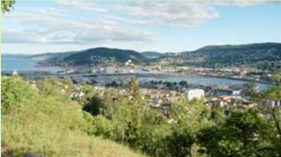
Utsikt fra Bragernesåsen.