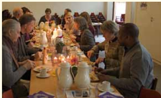
Hyggelig lunsj med staben i Bragernes ble det også tid til