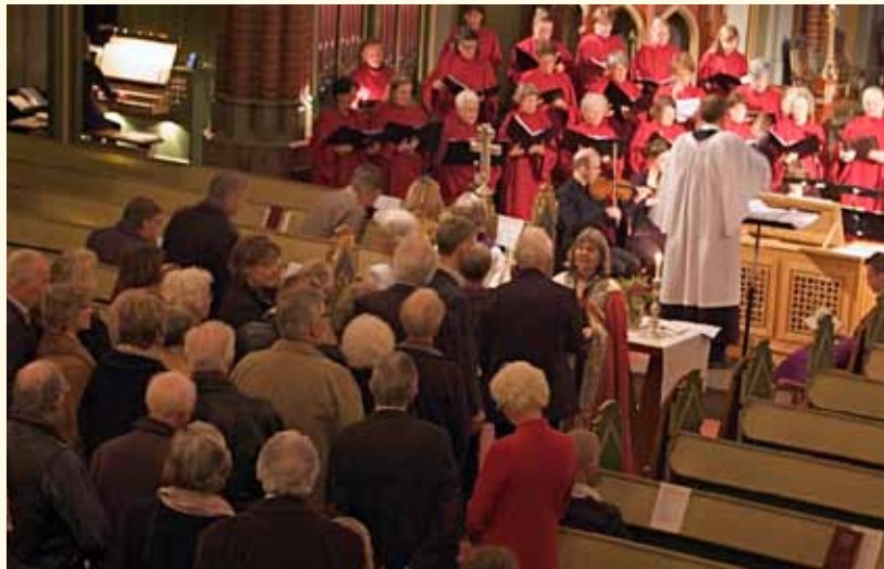
Biskopen medvirket ved gudstjenesten 1. søndag i advent