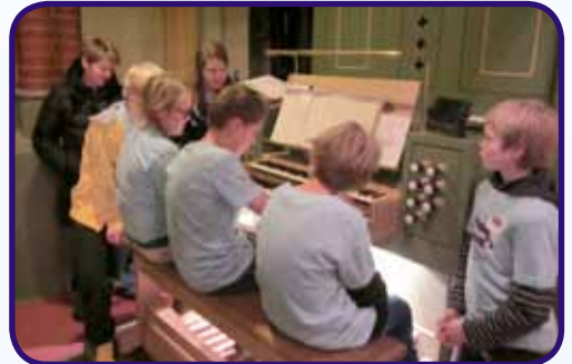
Barna fikk prøve seg på orgelet.