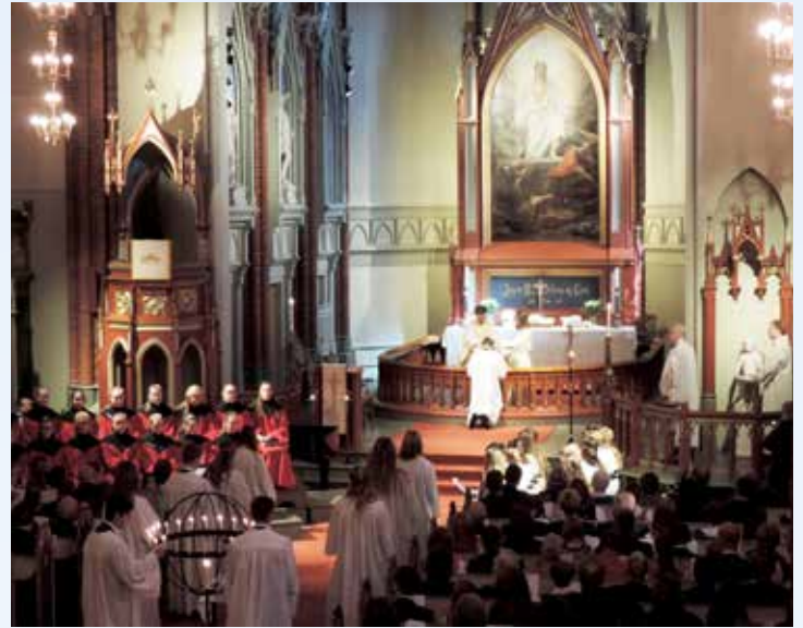
En utrolig flott seremoni på en minneverdig dag», var en av kommentarene etter konfirmasjonsmessen søndag 10. mai.

I år er det 69 konfirmanter i Bragernes, og her gjør noen av dem seg klar til inngangsprosesjonen ved den første konfirmasjonsmessen i år