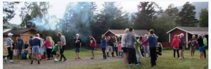
Det skjer mye både ute og inne