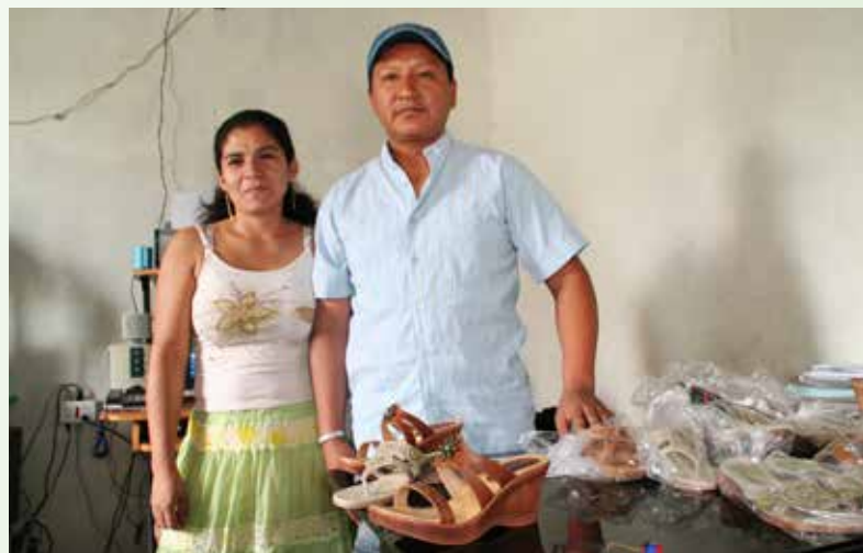
Mikrofinansbanken har gitt fattige mennesker i Ecuador nye muligheter

- Men det er mye arbeid som ligger foran oss for å bli så gode som vi synes vi må være for å bli et enda mer effektivt verktøy som skal gi mennesker muligheter til å jobbe seg ut av fattigdom.