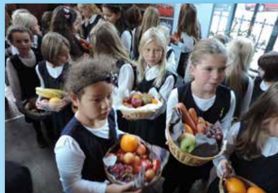
Jenteaspirantkoret delte ut frukt etter å ha imponert med flott sang på siste høsttakkegudstjeneste.

Jentekoret reiser til Sverige i juni. Koret synger konsert og gudstjeneste i Uddevalla kirke og tilbringer i tillegg noen timer på Liseberg.