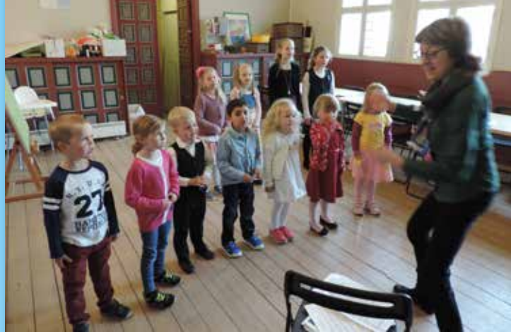
Miniores» på siste øvelse rett før debuten i kirken.

Tirsdag er diakon tilgjengelig for samtale 12.00–15.00 Torsdag er prest tilgjengelig for samtale 12.00 – 13.00