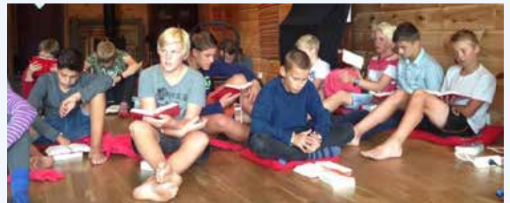
Konfirmantleiren i Uvdal er en viktig del av konfirmasjonstiden