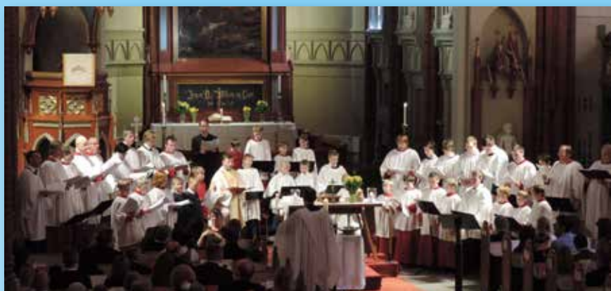
Oslo Domkirkes Guttekor og Bragernes Kirkes Guttekor deltok ved høymesse i Drammen og evensong i Oslo.