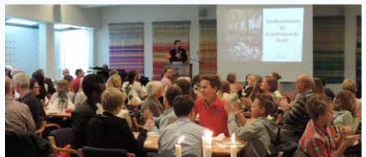
Konfirmantfesten i menighetshuset er avslutningen på forberedelsene