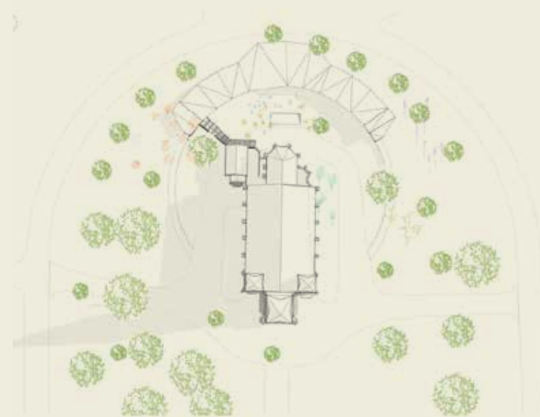
Arkitekt: Hildegunn Grønningsæter og Peer Bull-Hansen

I år er en prosjektgruppe under etablering, og den skal bestå av representanter fra menighetsrådet, staben og frivillige. Gruppen er så vidt i gang, og har laget en grov skisse av fremdriften. Det behøves flere frivillige, så hvis du har erfaring med byggeprosjekter, offentlige anskaffelser, eller annen relevant erfaring – ta kontakt!