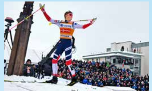
Målområdet til Skisprinten ved Bragernes kirke