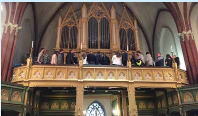
Et klart vårtegn: Brudeparsamling. Her får de lytte til bruremarsjer