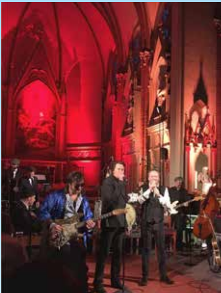
Elvis-konsert i kirken