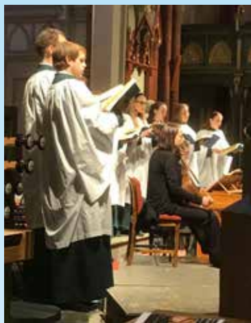
Johannespasjonen ble en mektig markering av langfredag