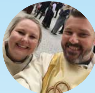
Prest og kateket fornøyde med vel overståtte konfirmasjonsgudstjenester