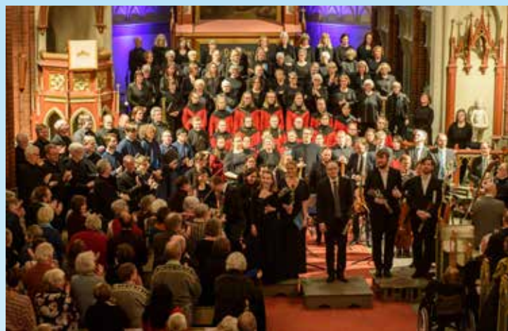
Mozarts requiem - en fantastisk oppsetning for en fullsatt kirke