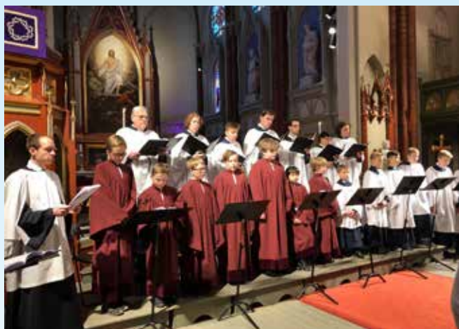
Besøk av Elverums guttekor, som sang sammen med vårt eget guttekor