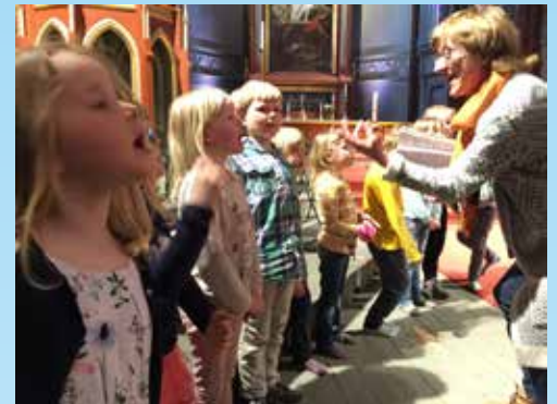
Minores er koret for 5 og 6-åringene. Alltid moro!