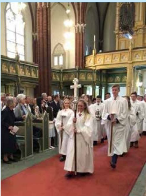
Spente og høytidelige konfirmanter på vei inn i kirken