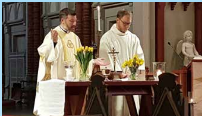
2. påskedag i Bragernes kirke