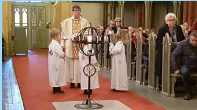
Små og ivrige hjelpere 1. påskedag