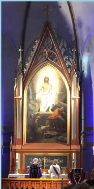
Skjærtorsdag med biskop Per Arne Dahl til stede