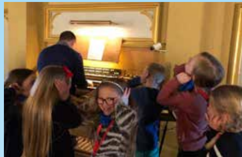
Tårnagentene lærte masse om kirken da de var på oppdrag!