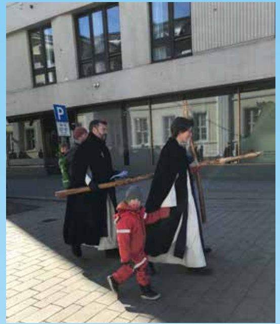
Korsvandring for kirkene i byen vår på langfredag