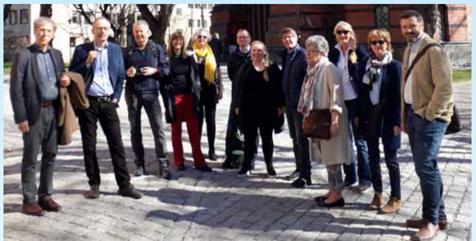
Staben på tur til Stockholm