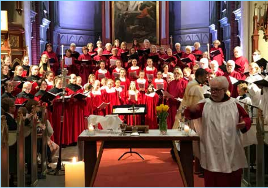
Markering av barnekorenes 25-årsjubileum