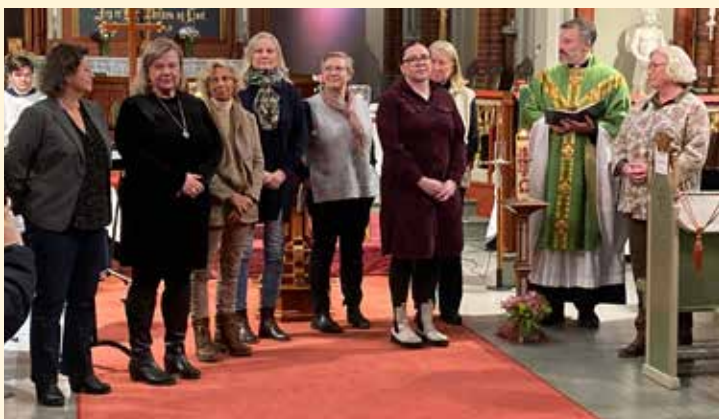
Presentasjon av det nyalgte menighetsrådet.