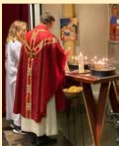
Lystening på Allehelgensmessen.