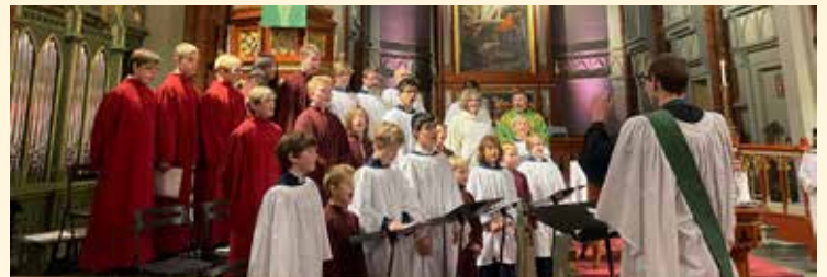
Tre guttekor sang i familiemessen da vi hadde besøk av guttekor fra Elverum og Norderhov.