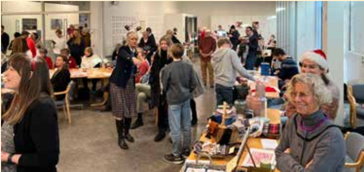
Adventsmarkedet var godt besøkt.