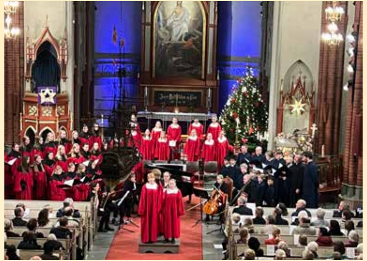
Korenes jubileumskonsert i Adventsfestivalen.