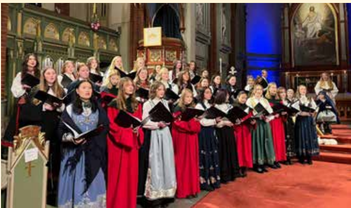
Jentekoret og ungdomskoret på julaften.