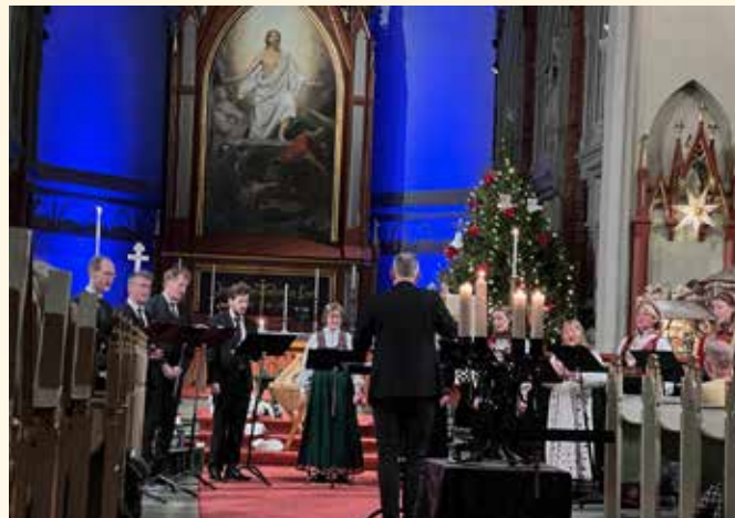
Midnattskonsert med Solistensemblet lille julaften.