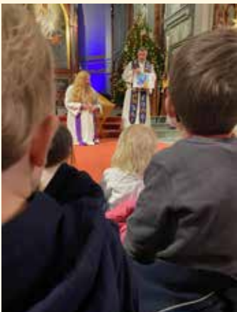
Julegudstjeneste med barnehagene.