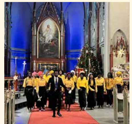
Anglikansk gudstjeneste 2. juledag.