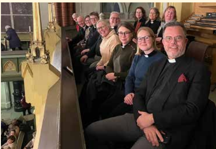
Besøk av prostene fra vårt vennskapsbispedømme Strängnäs i Svenska Kyrkan.