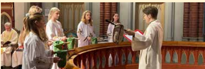
Diakon Edel og konfirmanter som ministranter.