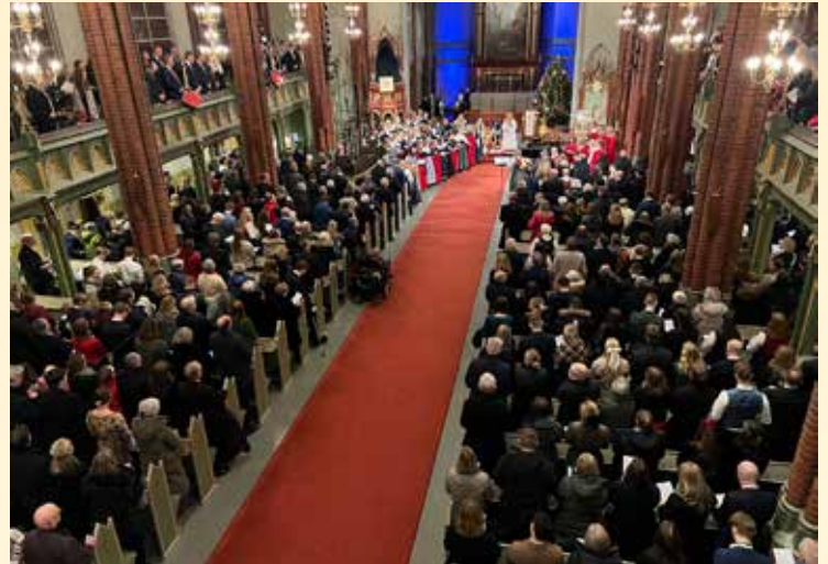
Julaften fyltes kirken ved alle de tre gudstjenestene.