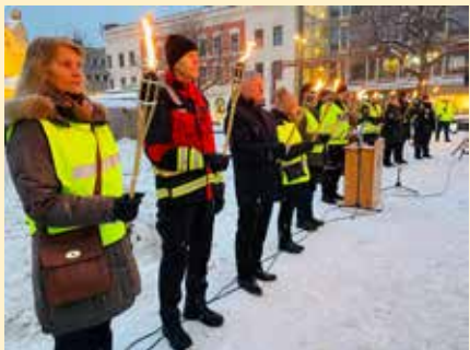
Bragernes menighet var medarrangør av Trafikkofrenes dag i Buskerud.