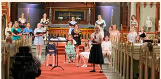
Så var det mulig å samles til konsert! Sommerkonsert med jentekor og ungdomskor.