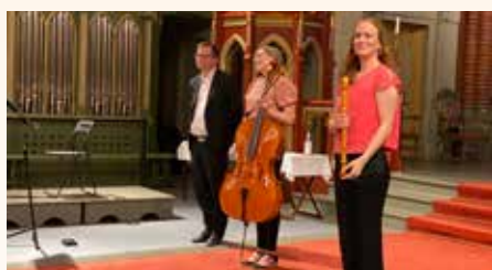
Sommerkonsert ved trio Dahl.