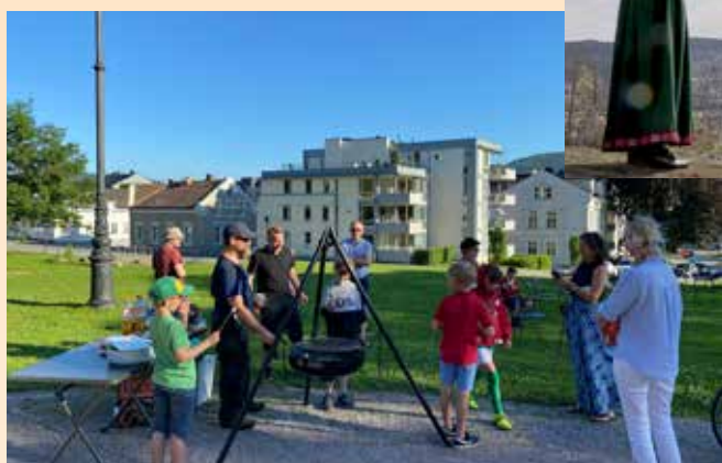
Sommeravslutning med guttekoret.