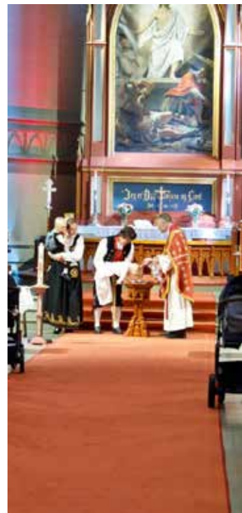
Bildene er fra Høymessen med markering av 150 år siden kirkens vigslingsdag og presentasjon av jubileumsheftet.