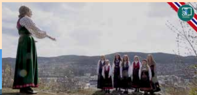
Også i år deltok jentekoret i kommunens digitale sending 17. mai.