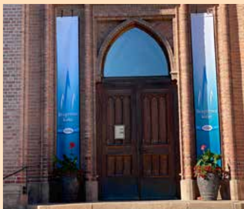
Jubileumbannere ved inngangen til kirken.