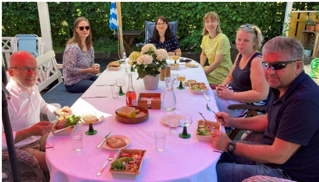
Fra sommeravslutningen for staben hos soknepresten

Stabsmiljøet i Fjell har vært godt lenge og var godt også i 2020. Vi trives sammen, og selv om 2020 også har vært preget av mye hjemmekontor for mange, har vi holdt hyppig kontakt på Teams. I perioder hvor koronarestriksjonene har vært mindre strenge, har vi møttes til ukentlige fysiske stabsmøter.