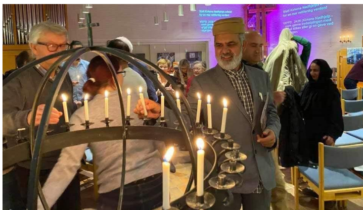
Fra temakveld uka før nedstengningen

5. mars inviterte vi til temakvelden “Sammen for en rettferdig verden” i anledning utstillingen “Ser alt du er” i Fjell kirke. Representanter fra Drammen Moské var med, og rundt bordene i peisestua etterpå ble Fjell menighet invitert på besøk til den nye moskéen etter gudstjenesten den 19. April. En glimrende plan, men som så mye annet kunne heller ikke dette realiseres. Men noe skjedde også i 2020.