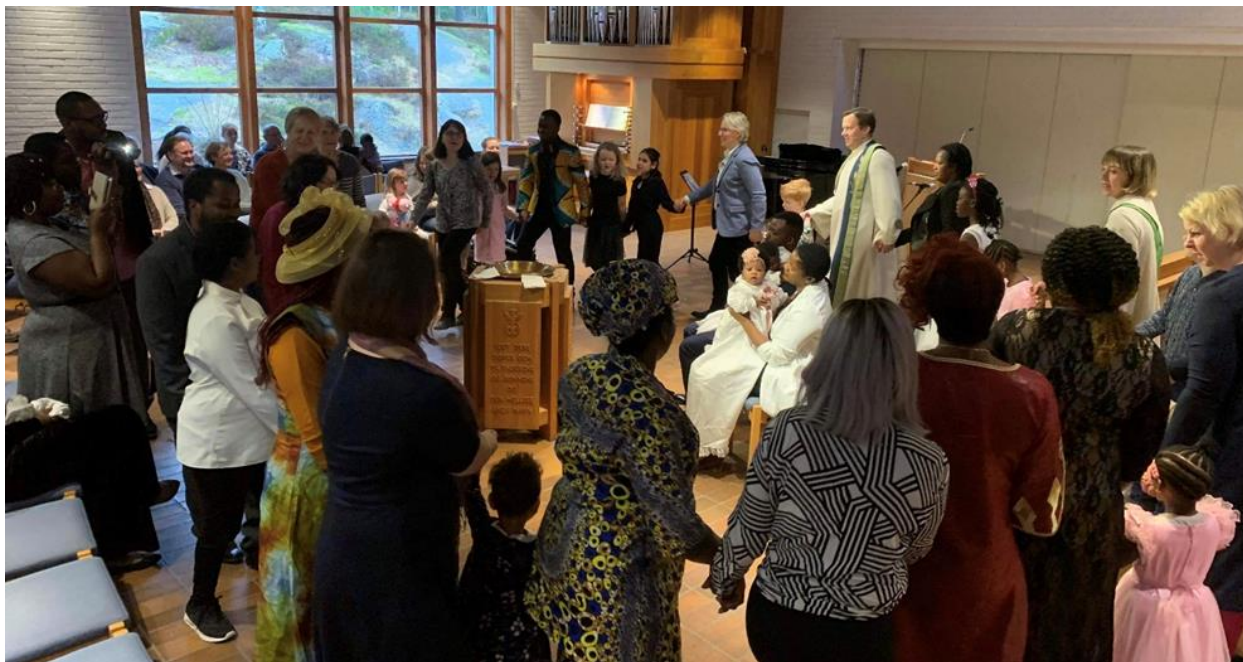
Fra gudstjeneste med dåp i februar 2020. I 2020 hadde vi en stor økning i antall dåp i kirken.