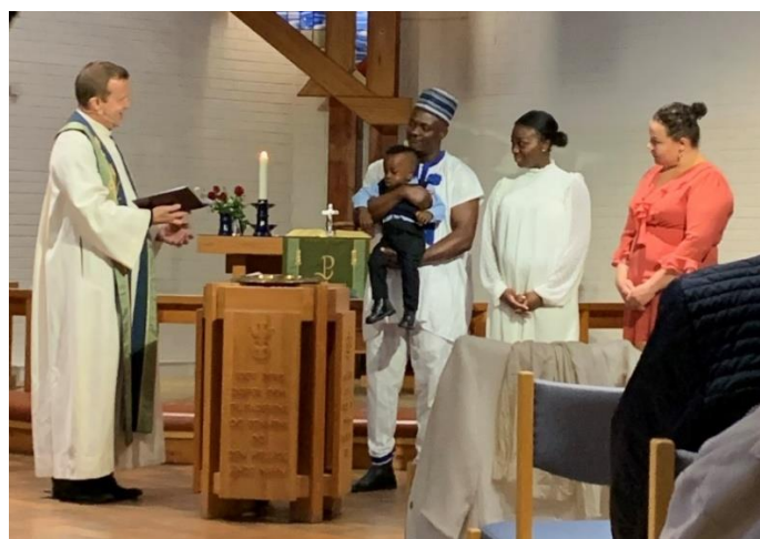
Fra en av de 9 dåpshandlingene i Fjell kirke i 2020

Vi hadde bare 1 konfirmant som valgte konfirmasjons-gudstjeneste i Fjell kirke. Likevel var det 5 av våre medlemmer som valgte kirkelig konfirmasjon (63%) , men de valgte konfirmasjons-gudstjeneste i andre kirker. Tror vi at det vil øke konfirmanttallet om vi har konfirmantopplegg i vår egen kirke?