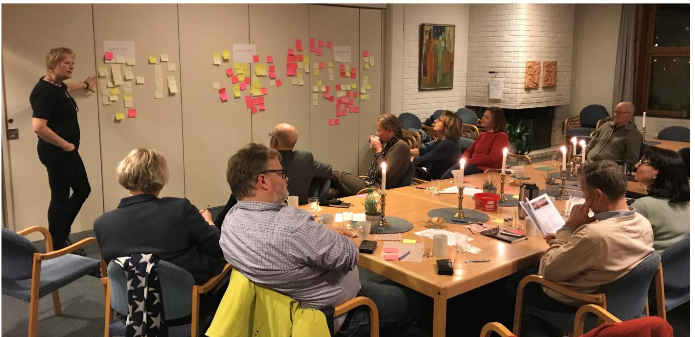
Fjell menighetsråd møttes for å jobbe med strategiplanen den 14. januar 2020.

Med nytt menighetsråd var det tid for å starte arbeidet med ny strategiplan for menigheten. Arbeidet preget våren 2020, før den ble vedtatt den 15. april 2020. Planen skal gi retning for arbeidet frem til 2024.