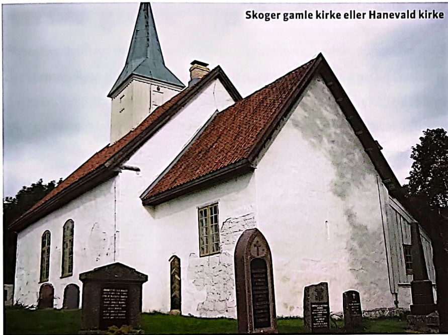
Skoger gamle kirke eller Hanevald kirke

”Det postmoderne menneske blir pilgrim” sa statsråd Giske på Pilegrimskonferansen i Trondheim 3. august i 2009. Hvem ville for 20 år siden tro at en 500-årig forbudt virksomhet skulle blomstre? Kanskje den blomstrer like friskt om noen år, som det den gjorde i Norge fra 1031 til den dansk-norske reformasjonen ble innført etter kongelig krav i 1537.