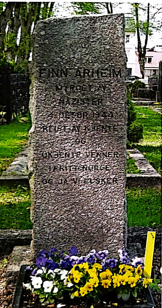
Finn Arheims minnestein