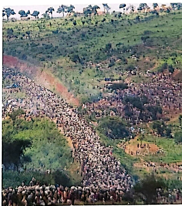
43 millioner på flukt.

Flyktningshjelpen har en over 60 år lang historie, men den humanitære arven går helt tilbake til Nansen. Vi ble dannet i 1946 under navnet Europa-hjelpen for å hjelpe flyktninger i Europa etter 2. verdenskrig. I dag samarbeider vi med FNs høykommissær for flyktninger (UNHCR) om Nansenprisen som viderefører arven etter den første høykommissæren for flyktninger, Fridtjof Nansen.