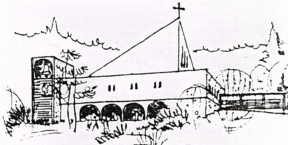
Fjell kirke. Perspektivskisse av arkitekt Elisabeth Fidjestøl.