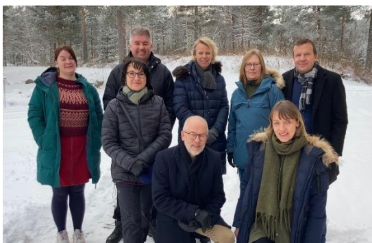
8 i staben vinteren 2022

Staben har også i 2022 jobbet godt sammen og det har vært en god stemning.