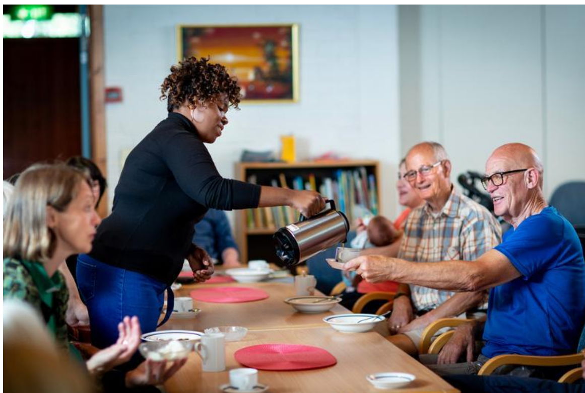
Menighetstreff med S-klassen fra Drammen Vdg. skole. En diakonal nysatsning i 2022