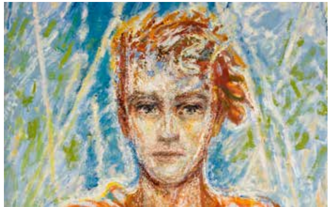
Detalj altertavle Henrik Sørensen.

Hovedtema for markeringen er «Nåde» med tre undertemaer som er hentet fra Det lutherske verdensforbunds reformasjonsfeiring; «Frelsen er