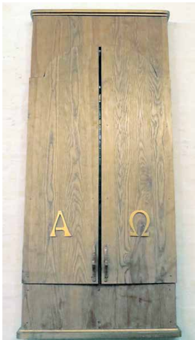
Ikonet er lukket i fastetiden. Se det åpne ikonet på forsiden.

Nederst til høyre er motivet pinsedag. 12 røde ildtunger faller ned på disiplene. Det sentrale motiv er den oppstandne Kristus på den himmelske trone, omgitt av kjeruber. Sirkelen er et symbol på evigheten. De fire hjørnene på det røde bakteppet er jor-