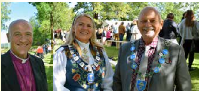
Biskop, ordfører og fylkesordfører i Viken.

Fra galleriet hørtes det gamle orgelet – det nest eldste orgelet som fortsatt er i bruk i Norge. Or-