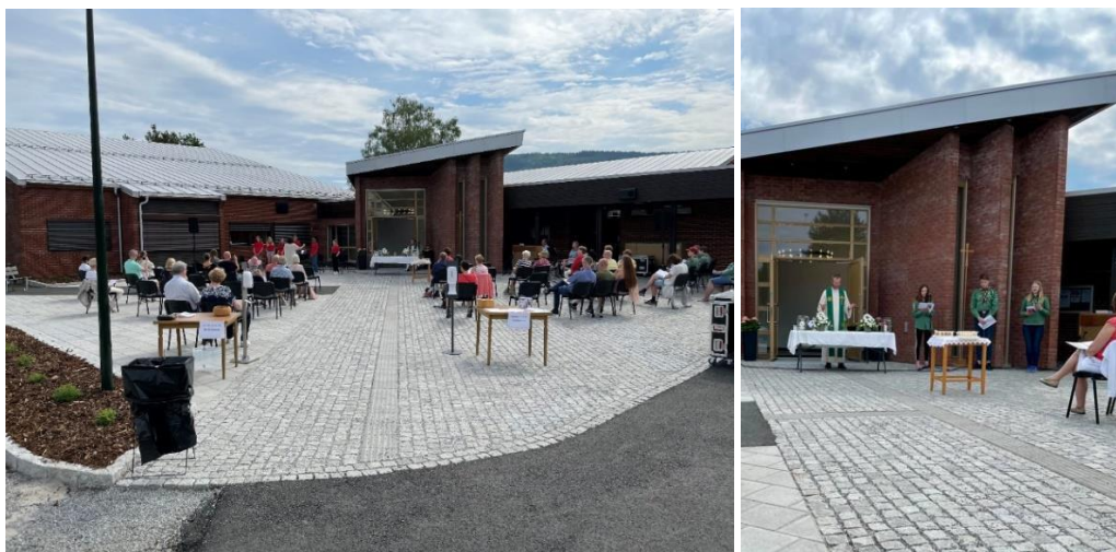
Fra familiegudstjeneste på kirketunet 7. juni.

Festivalen ble avsluttet med familiegudstjeneste på kirketunet 7. juni, der bl.a. Soul Children og speidergruppa medvirket.