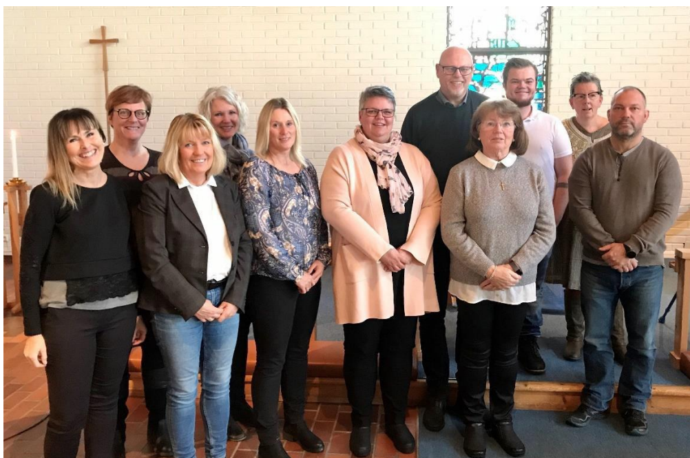
Presentasjon av nytt menighetsråd i gudstjenesten 17.11.19.