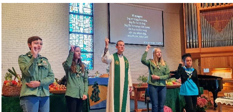
Høsttakkefest familiemesse 17.10.21.

Høsttakkefest familiemesse ble avholdt for fjerde gang sammen med utdeling av boken Helt førsteklasse. Speiderne deltok i gudstjenesten og pyntet med masse fra høstens grøde, og Nedre Eiker Soul Children sang. Kirkekafe med lapskaus etter gudstjenesten. Et flott og godt samarbeid!