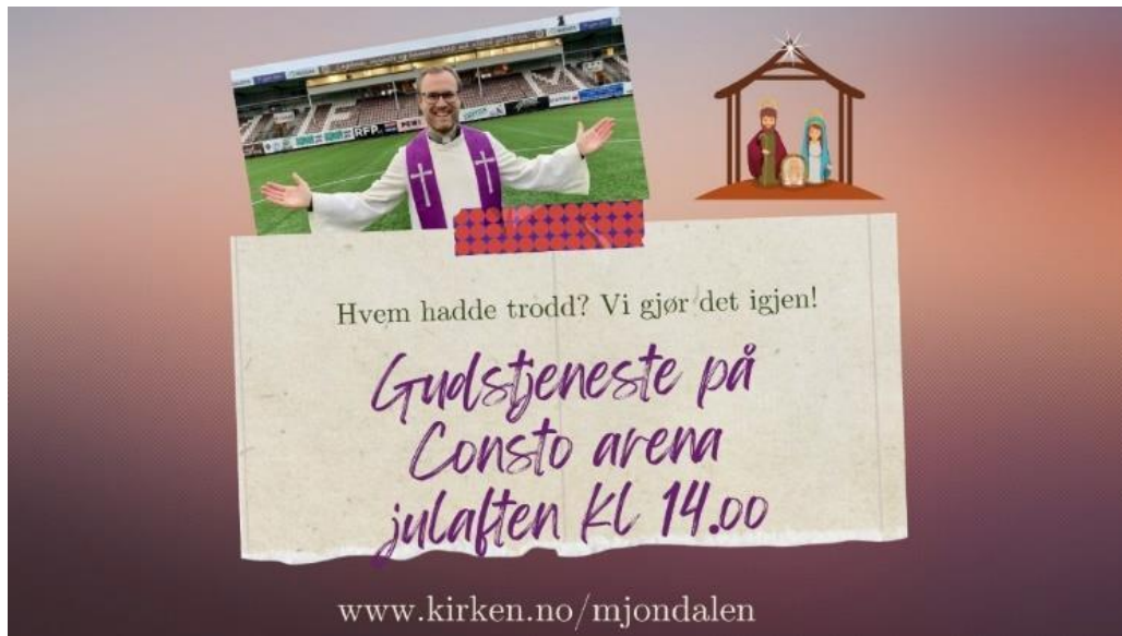
Foto: Rune Folkedal, Drammens Tidende. Plakat laget av Hilde Mari Ski.

Også dette året ble det noen oppslag i media; i radio (NRK Buskerud) og avis (Vårt Land). Det var mange høydepunkter dette året; med åpning av nytt tårn, digital satsning og julaften på Consto Arena, for å nevne noe.