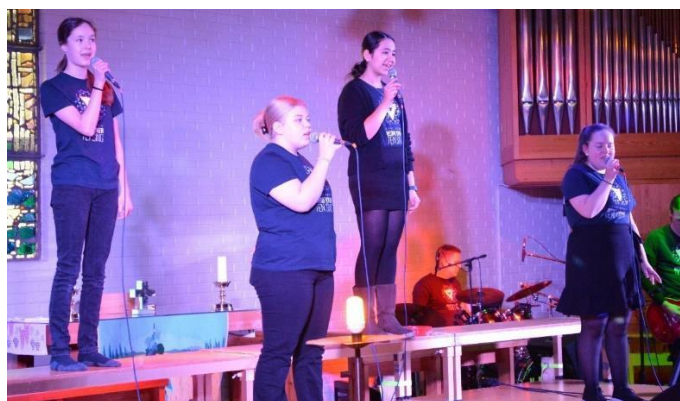
Julekonserten 10. desember i Mjøndalen kirke.

24.12: NETS sang på julegudstjeneste på Consto arena.