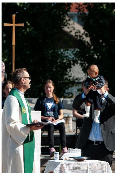
Dåp på torget.