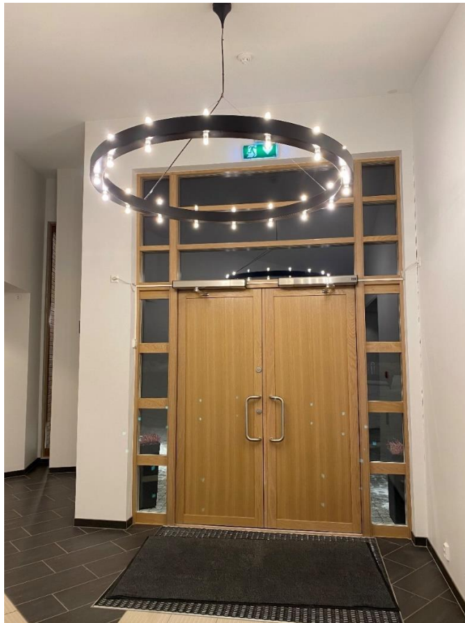
Ny lysekroner til nytt inngangsparti i Mjøndalen kirke 2021.

Årsregnskapet godkjennes på menighetsrådsmøte 24.02.22.