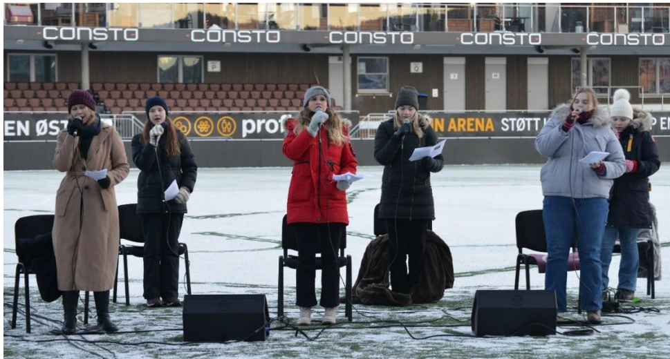
Nåværende og tidligere NETSere sang på Consto arena 24.12.

I tillegg har vi gjennomført styremøter, opplæring av våre dirigenter og samlinger for voksenlederne. 4 NETSere ble sendt på TenSing Seminar til Ulsteinvik på direksjon-, dans- og styreleder kurs i begynnelsen av august.