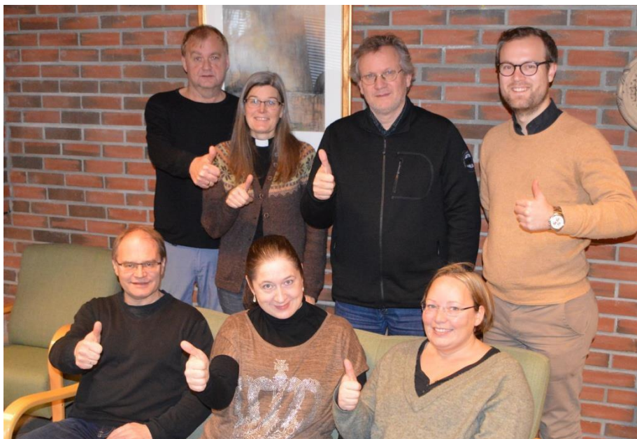
Staben i Mjøndalen kirke: