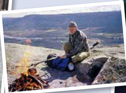
Kaffelars på Knabben.