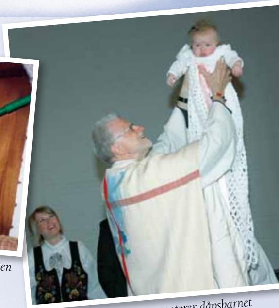
En engasjert sokneprest presenterer dåpsbarnet for menigheten.