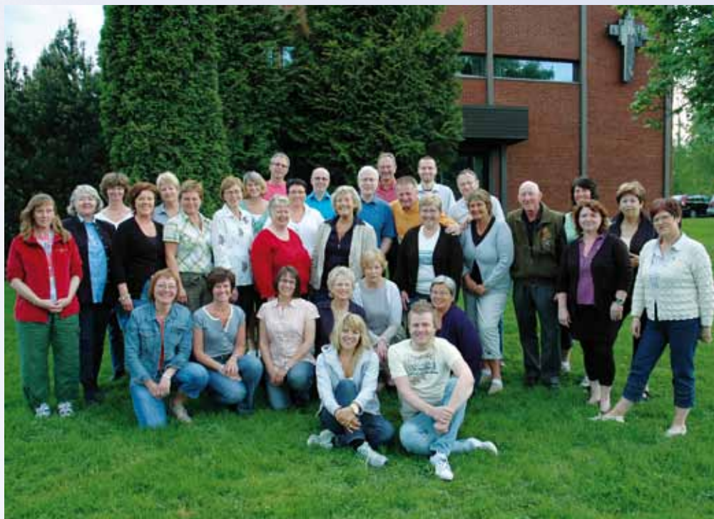
Voksengospelkoret i Nedre Eiker trenger ny musikalsk ledelse.