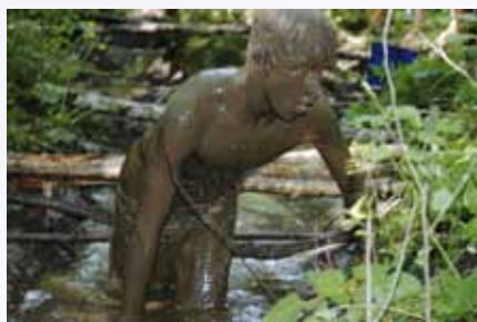
Arkivbilde fra en av aktivitetene til 69 grader Bø.

I flere år har en del av konfirmantene vært på leir om sommeren. Du kan gå inn på www.krik.no/konfaktion for å se hva det er.