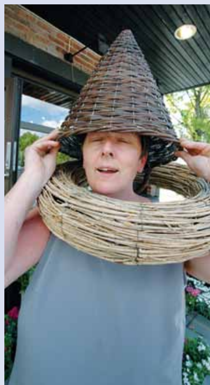
Kirkens nye overhode?

Mange spørsmål kom, men jeg ble ført opp på valglisten av nominasjonskomiteen. Ble jeg valgt inn var jeg klar til å brukes. Jeg fant ut at Mjøndalskirken er min kirke nå, og derfor mitt ansvar.