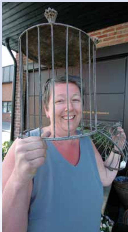
En dame med mange påfunn.

Jeg ble litt eldre og fant plutselig på at jeg ville inn i speideren, da ble det hos Frelsesarmeen som solstråle. Jeg husker at jeg reiste aleine på speiderleir, for det var ingen andre i gruppa som skulle. Jeg syntes det var helt greit å være en solstråle blant blåspeidere og