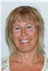
Tekst: Kari Nedberg

Det nye menighetsrådet er godt i gang med sitt arbeid