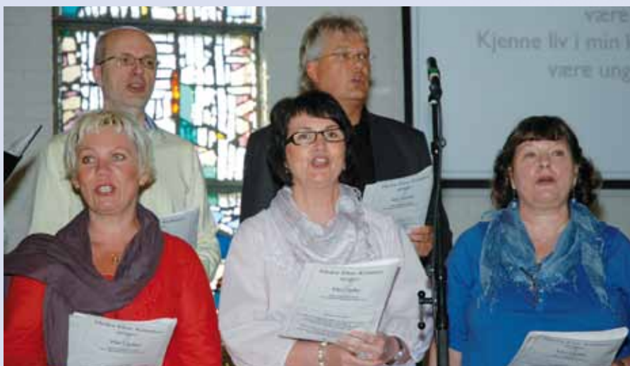
Noen av medlemmene i Nedre Eiker kirkekor i aksjon under arrangementet «Nedre Eiker synger» den 18. april.

Menighetsrådet er opptatt av å ha en god dialog med staben. Dette er i gang, og vi vil fremover samarbeide rundt planer for diakoni, gudstjeneste, kirkemusikk og barn og ungdom der trosopp-læringen nå særlig er aktuell. Det ligger mange muligheter fremover til å endre