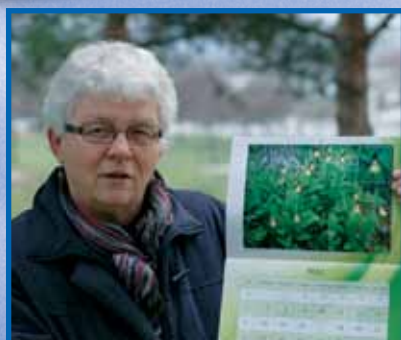
Ny lokal kalender for 2012