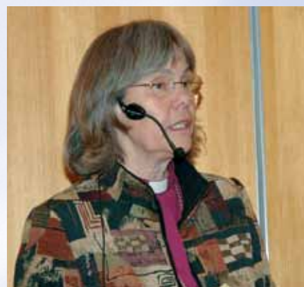
En engasjert biskop oppfordret til dialog og engasjement rundt gudstjenesten.