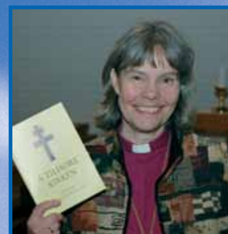
Har kirken utspilt sin rolle?