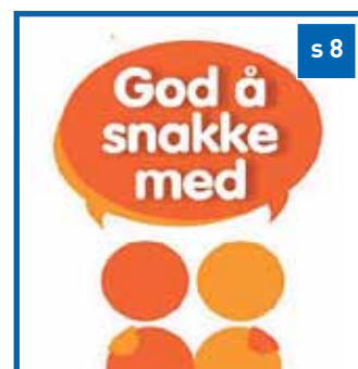
Konfirmanter i mai