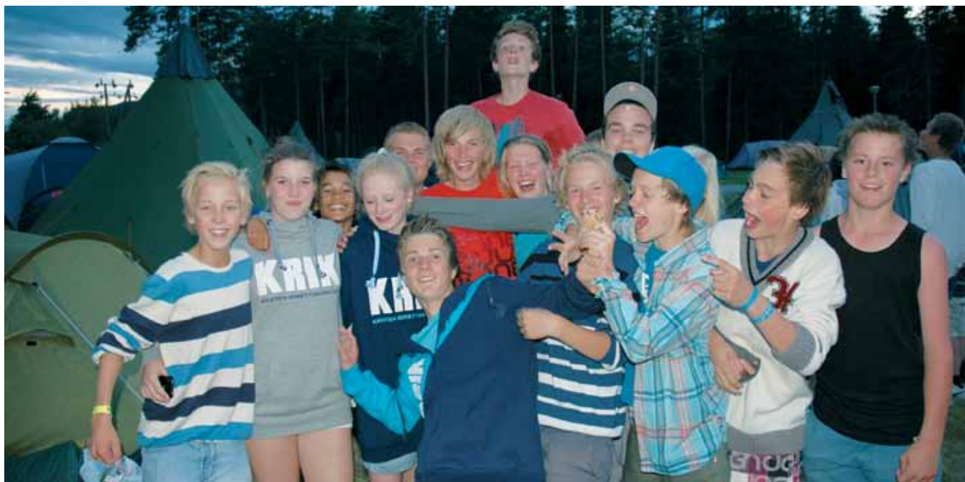
Et knippe av årets konfirmanter under konfeksjon i 2011.