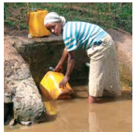
Ung jente som henter vann ved plassen hvor prosjektet sikrer vannet.

I 2008 ordnet prosjektet med papirene fra staten og kom så med sement, rør/ledninger og en spesialist, som styrte arbeidet. Befolkningen måtte skaffe steiner og trematerialer og stille opp med arbeidskraft. Nå ble vannhullet til en trygg vannpost. Vannet kommer gjennom to rør og er klart og rent. Riktignok må folk stå i vannet for å kunne tappe vannet, siden det ikke var nok hellingsgrad i området, men de står på en støpt plattform. Vannet blir fylt i kanister og så båret hjem på ryggen – selvfølgelig av jenter og kvinner. Vann- og vedbæring er tradisjonelt kvinnearbeid i Etiopia. Noen benytter også anledningen til å vaske føt-