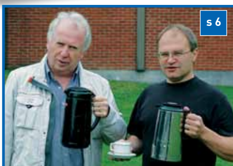
Klang i kaffedralen