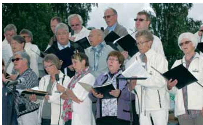
Et sammensatt kor bidro med flott sang. Her noen av deltakerne.