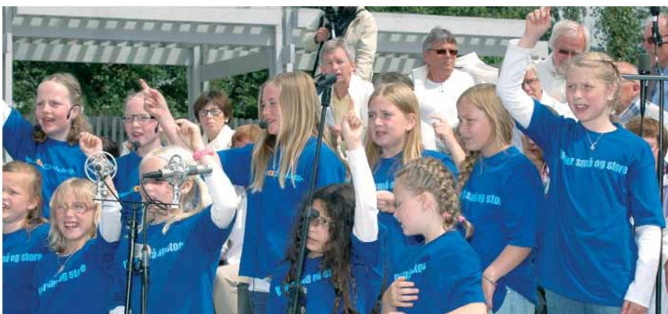
Kor for små og store og Mjøndalen Soul Children bidro med sang.