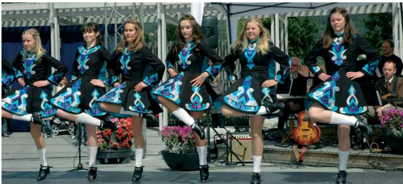
Dansegruppen Celtic Inspiration fikk velfortjent applaus for sitt dansenummer.