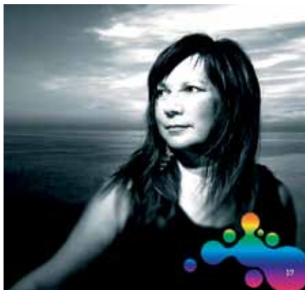
Mari Boine er en av artistene som opptre under festivalen.

Festivalen blir offisielt åpnet onsdag 26. september og varer til og med fredskonserten i Strømsø kirke søndag 30. september. Det blir konserter på Union scene og i Strømsø kirke fra torsdag til og med søndag i festivaluka. En egen utstilling blir satt opp utenfor Union scene ved elva og det blir en rekke aktiviteter som vil prege byen gjennom festivaldagene. Vi samarbeider i år med Drammen kino, Drammen filmklubb, Modum Bad og Sekkefabrikken i Slemmestad. Følg med på festivalens hjemmesider www.drammensacred.no og på Facebook for oppdatert informasjon.