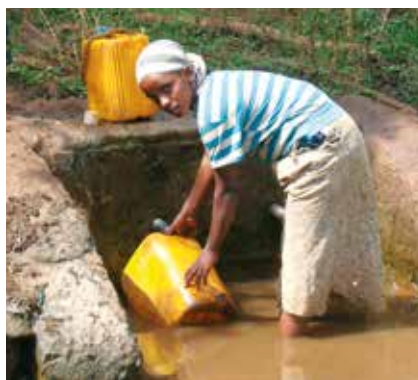
Ung jente som henter vann ved plassen hvor prosjektet sikrer vannet.

Ønsker du å støtte misjonsprosjektet så ta kontakt med kirkekontoret på tlf.: 32 23 68 60, eller via e-post: knut.finquist@neiker.no