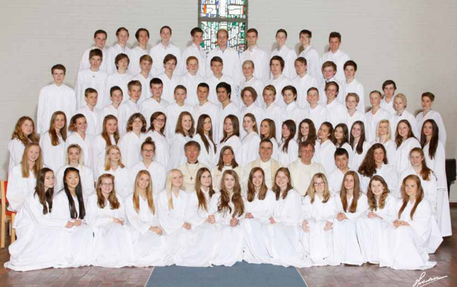
Konfirmantene i Mjøndalen menighet 2012/2013.