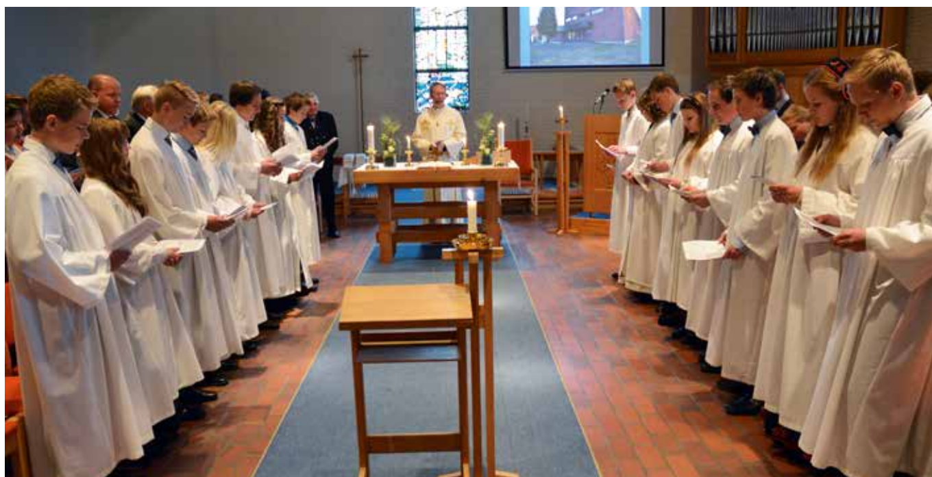
Fra konfirmasjonsgudstjenesten 12. mai kl. 12.30.