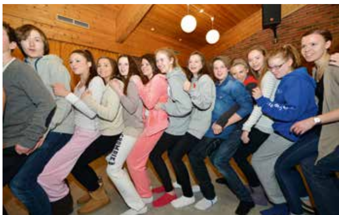
Fellesaktivitet for konfirmantene under arrangementet FreeZone.