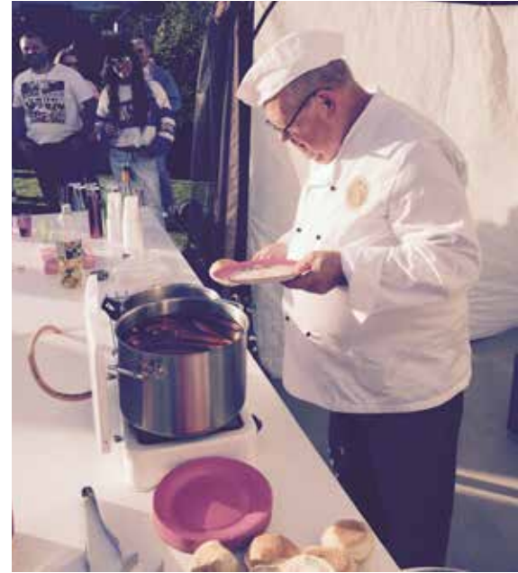
I full bløytauniform.

• Bygging av stadion i MIF-regi krevde 100% støtte i alle deler av foreningen. Det bidro Tor til.