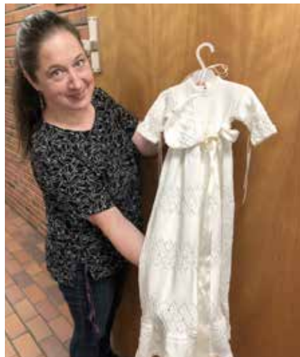
Kirkekontoret leier ut dåpskjole

Mange døper barna sine fordi det er en familietradisjon. Dåp er likevel ikke et like naturlig valg, slik det var for noen år siden. Dåpstallene synker. Selv medlemmer i kirken lar være å døpe sine barn. Det kan være mange årsaker til dette, men jeg håper at dåpen ikke velges bort fordi selskapet koster penger eller at det er for slitsomt å arrangere dåpsselskap. For det må ikke være slik. Husk at det er dåpen som gir barnet medlemskap i Den norske kirke. Vi har