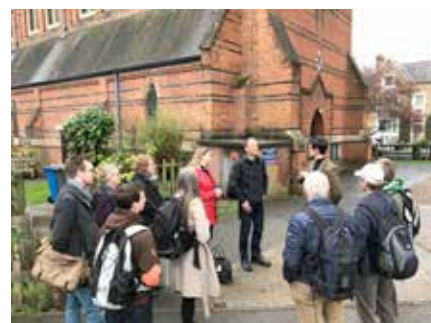
Vi fikk god informasjon fra lokale menigheter