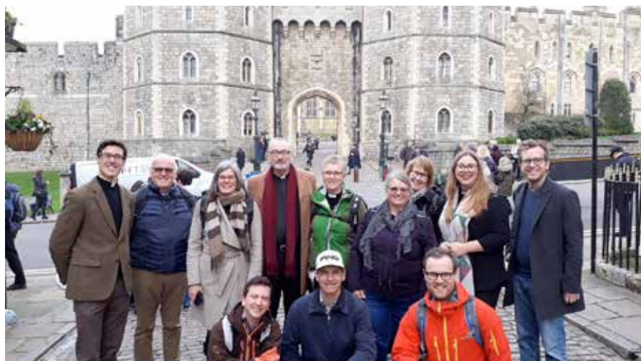
Hele reisefølget foran Windsor Castle

Studieturen var også viktig av andre grunner; i Eiker prosti har det vært mange nyansettelser de siste fire årene. Her i Nedre Eiker er 3 av 4 prester relativt nytilsatte, og det var flott å bli litt bedre kjent med hverandre.