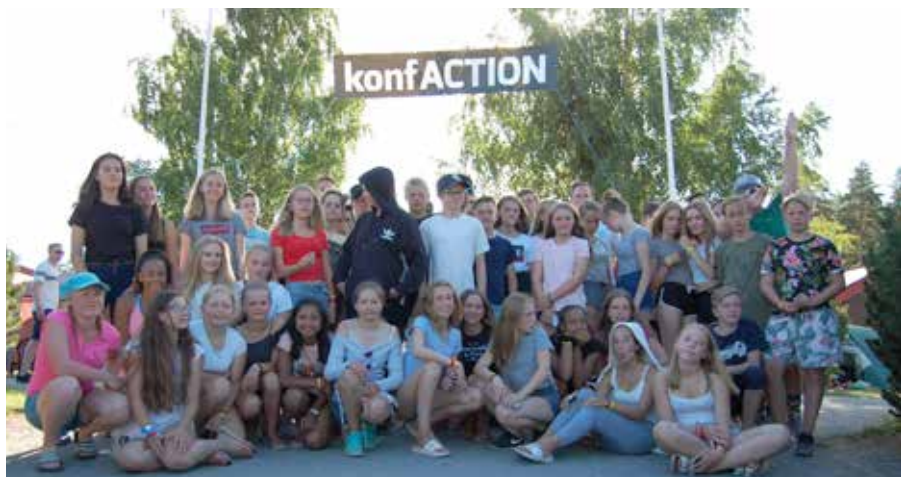
Deltagere fra Mjøndalen. Se flere bilder fra leiren på side 16.

Konserten ble også en avskjed med dirigenten; hun forlater oss for å ta fatt på studier. Så nå må koret ut å lete etter ny dirigent – kan det være deg? Se mer om Nedre Eiker Soul Children på side 11.