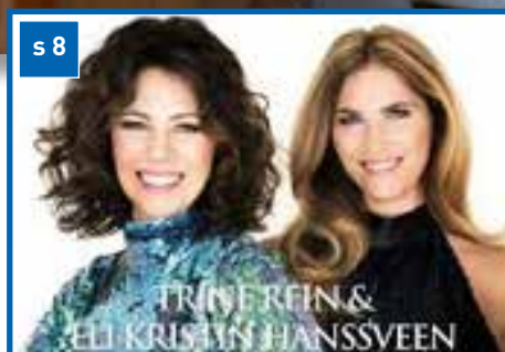
Stor kulturhøst i kirkene