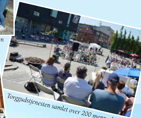
Torggudstjenesten samlet over 200 mennesker