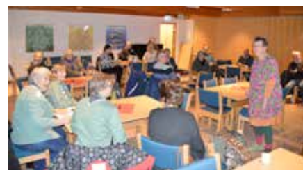
Mange nysgjerrige tilhørere.

under, trukket nærmere Vikveien og Nedbergkollveien, samt nytt inngangsparti. Både tårn og inngangsparti tar opp i seg takvinklene fra eksisterende bygg, og det vil gi et estetisk løft for Mjøndalen kirke, samt løse en del praktiske utfordringer med tanke på lagring og synlighet. En gangvei opp gressbakken til kirken er også foreslått.