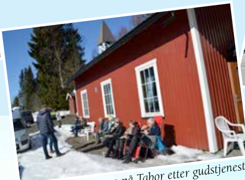
Påskekos i solveggen på Tabor etter gudstjenesten