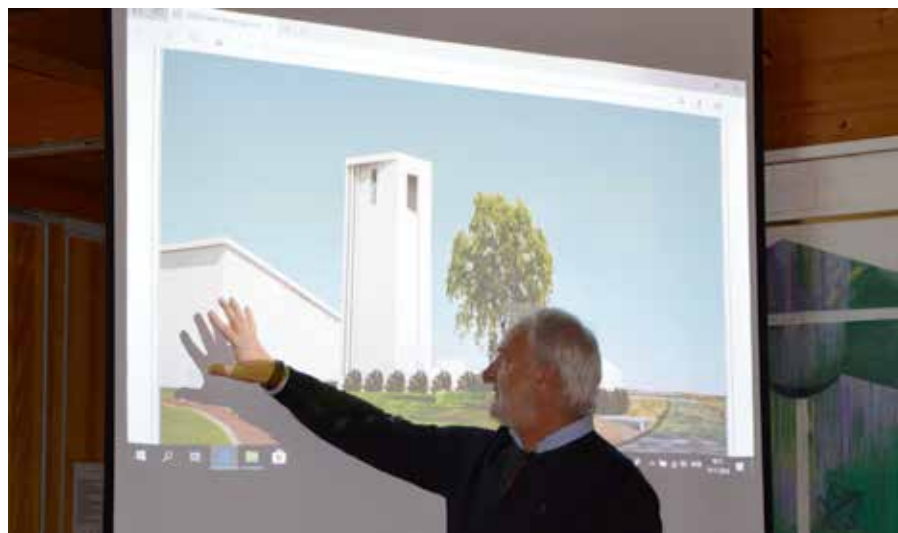
AD-arkitekters forslag til løsning.