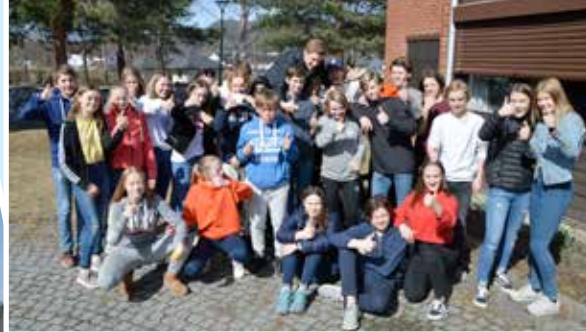
Konfirmantene samlet inn 46 tusen i fasteaksjonen