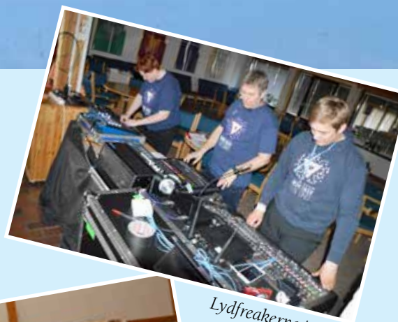
Lydfreakerne i NETS