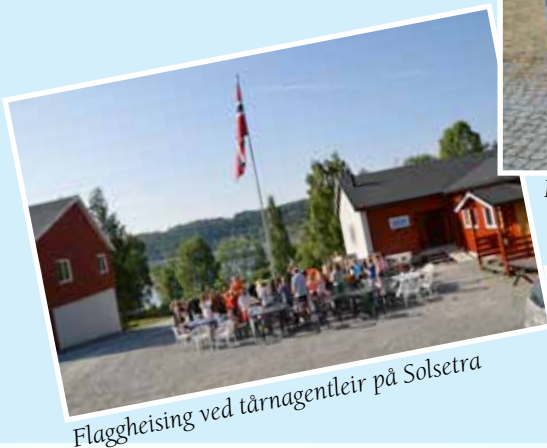
Flaggheising ved tårnagentleir på Solsetra