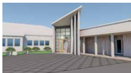
Forslag til nytt inngangsparti.

AD Arkitekter ble kontaktet for å tegne et forslag til nytt klokketårn og se på muligheter for lagring. Etter befaringen gav arkitekten de samme tilbakemeldingene som over, og vi fikk et spennende forslag til nytt klokketårn med garasje