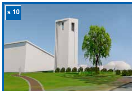
Perleraden lille julaften