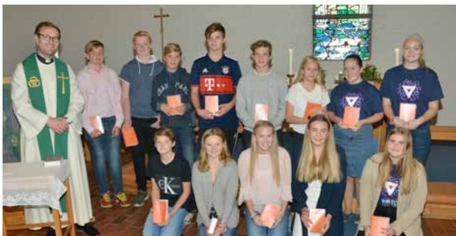
Menighetsgruppe og NETS-konfirmanter