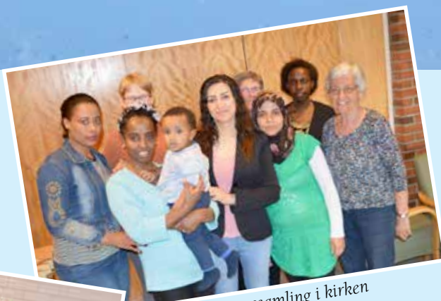
Integreringssamling i kirken

Mjøndalskjerka ønsker alle en velsignet jul