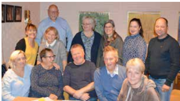
Humøret er på topp når menighetsrådet jobber for Mjøndalskjerka.

og praktisk med gjennomføring av arrangement.