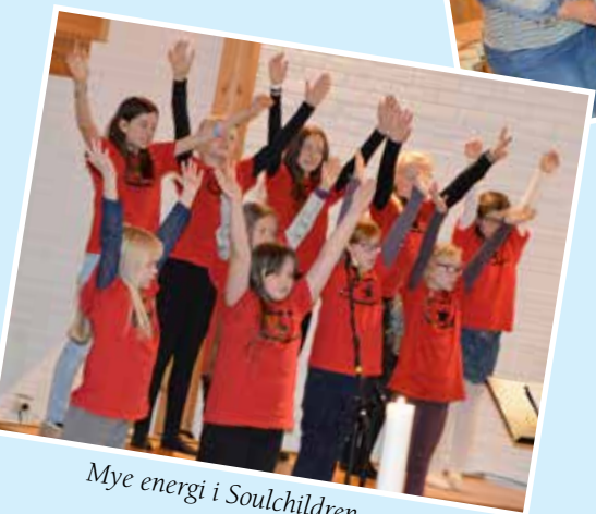
Mye energi i Soulchildren