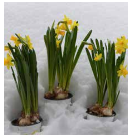
Mjøndalskjerka ønsker alle God Påske

Påske feires i hele den kristne verden. Oppfordringen er at Mjøndølinger får med seg en flik av den ekte påskefeiringen hvor de enn måtte befinne seg.