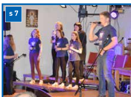
NETS feirer 30 år