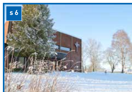
Påske er kirketid