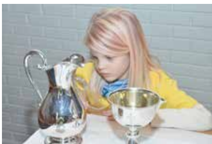
På let etter gullkorset

8 agenter fra Mjøndalen og Nedre Eiker menigheter var samlet til symboljakt i kirken, lek, god mat og ikke minst løste barna mysteriet med gullkorset som var stjålet. Heldigvis ble det funnet igjen før «Skummulus» rakk å ta det med seg. Samlingen ble avsluttet med en ekte Tårnagentgudstjeneste og kirkekaffe. Se flere bilder på side 16.»