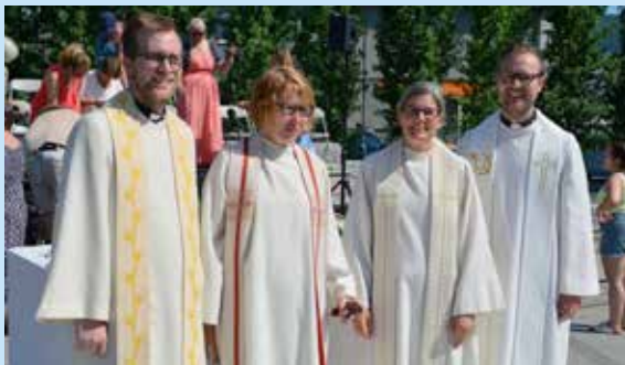
Fulltallig prestekorps på torgmessen i 2018.