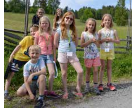
Snushaner på agentleiren i 2017

14. til 16. juni 2019 inviterer vi barn på 2. til 4.trinn til agentleir på Solsetra. En agentleir er som seg hør og bør en