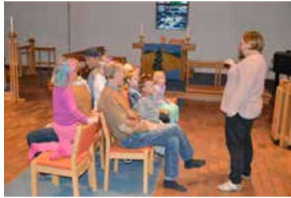
Aktivitet på Mylder

arrangeres i Mjøndalskjerka og er for barn fra 1 til 6 år, gjerne med foreldre, der vi tilbyr et enkelt måltid og aktiviteter tilpasset aldersgruppen som deles i 1 – 3 år og 4 – 6 år. Siste samlinger i vårsemesteret er 11. april og 9. mai. Etter sommerferien starter vi opp 29. august.