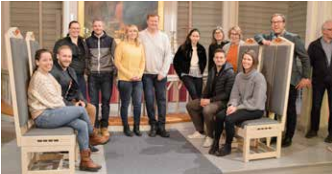
Noen ville innta hovedplassen og teste stolene og alterringen.

Dessuten fulgte prestene opp med nyttige, praktiske råd som gjør vigselsseremonien til en fin og verdig opplevelse for bryllupsgjester og andre som deltar og ikke minst for brudeparet.