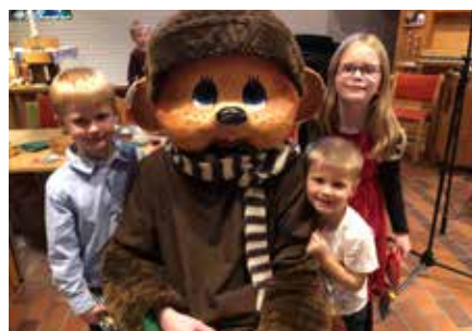
En tålmodig og populær Bruno under utdelingen.