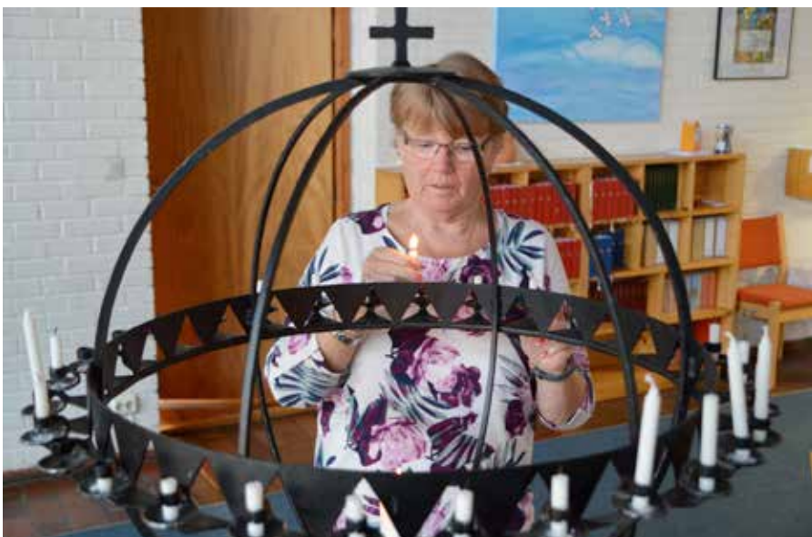
Å tenne lys i lysgloben gir fred og omtanke for andre.