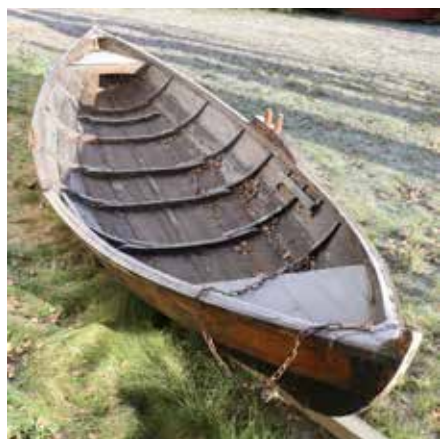
Nersetterbåt på Temte gård.

Nersetterbåt eller «jager» var betegnelse på robåter som ble brukt i forbindelse med tømmerfløtingen i nedre del av Drammensvassdraget, men også til elvefiske. Opprinnelig var en nerset-ter betegnelse på dem som transporterte