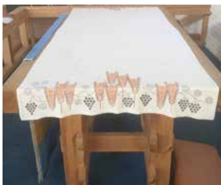
Alterduken sett fra orgelsiden