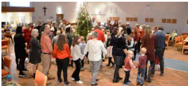
3 ringer og de kjente, kjære julesangene.

Nær 100 fremmøtte i alle aldre – selvsagt mange barn – lot seg engasjere med Nedre Eiker Soul Children, pølser og kake, utlodning, barneleker og gang rund juletreet.