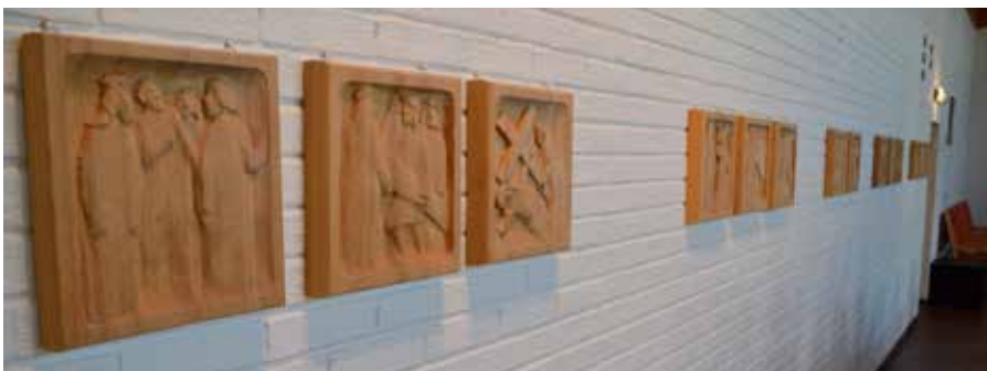
Rekken av relieffer.

Oversikt over hva relieffene handler om.