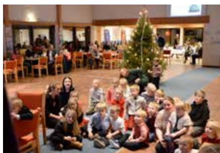
Lydhøre barn fikk oppleve juleevangeliet.

Årets juletefeste ble gjennomført på tradisjonelt vis, med mye folk, livlig gang rundt juletreet og mange barn i aktivitet. Pølser, kaker, saft og kaffe, sang av Nedre Eiker Soul Children og masse leker for barna. Og til slutt ble det poser