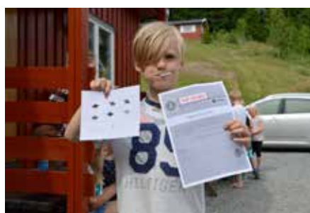
Fra tidligere tårnagentleire på Solsetra.

Agentleiren arrangeres av NMSU og samler barn fra flere menigheter. Mjøndalen har 12 plasser til disposisjon, og det er ennå ledige plasser for de som har lyst til å være med.