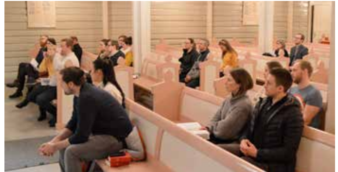
En lydhør forsamling følger med og noterer.