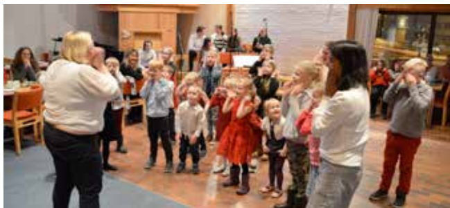
Barna deltok ivrig i leker og konkurranser.