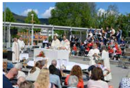
Fra torgmessen 2018.

Kirken tilbake der det startet. Før alle kirkebyggene kom var det på torget folk møttes. Her hørte de hjemme. De sang og feiret. De samtalte med hverandre. Slik ble menighetene blant de første kristne dannet.