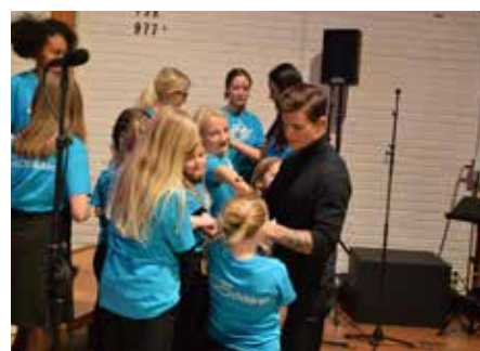
Nedre Eiker Soul Children i støtet s 11 og 16