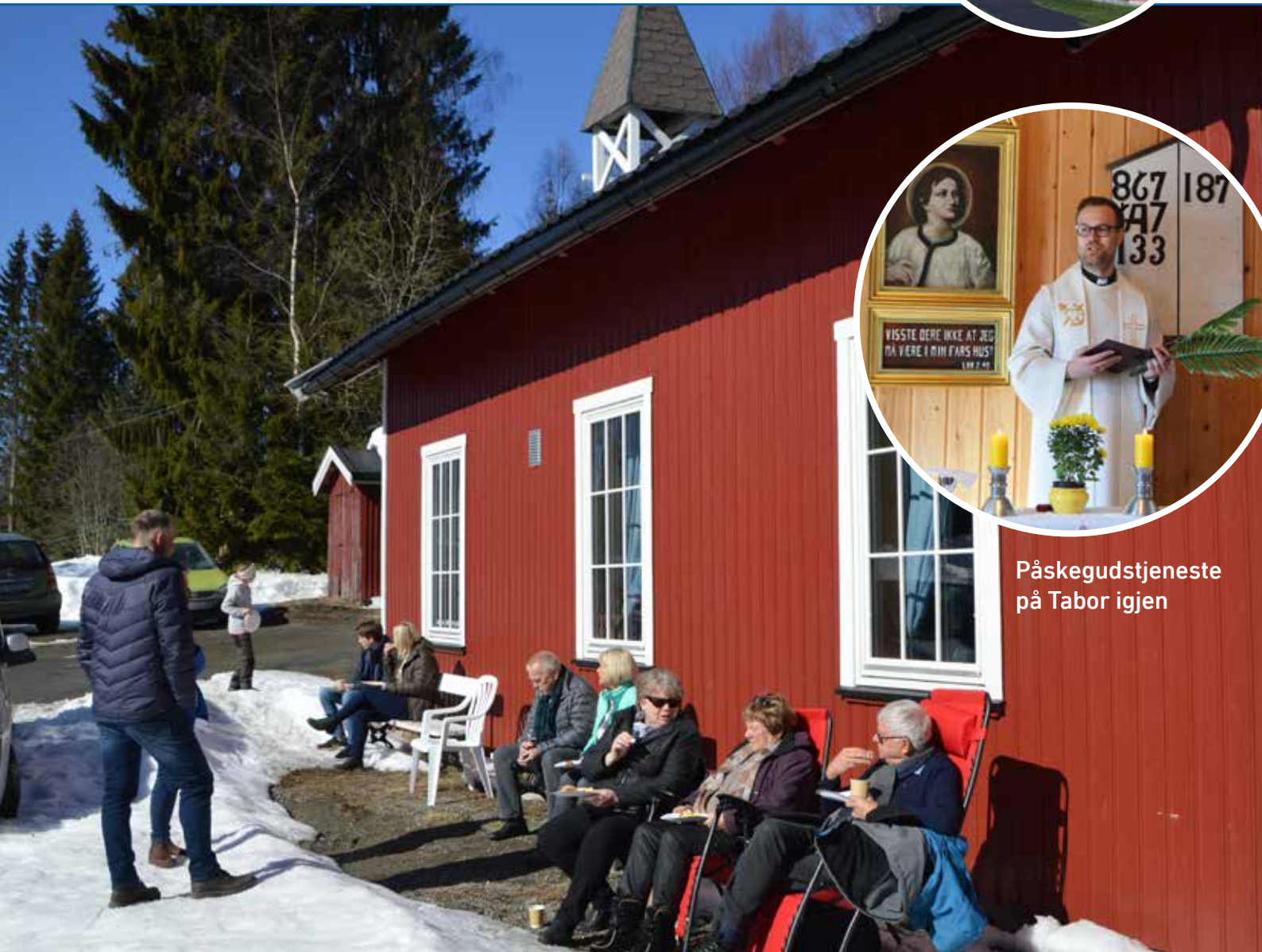
Påskegudstjeneste på Tabor igjen