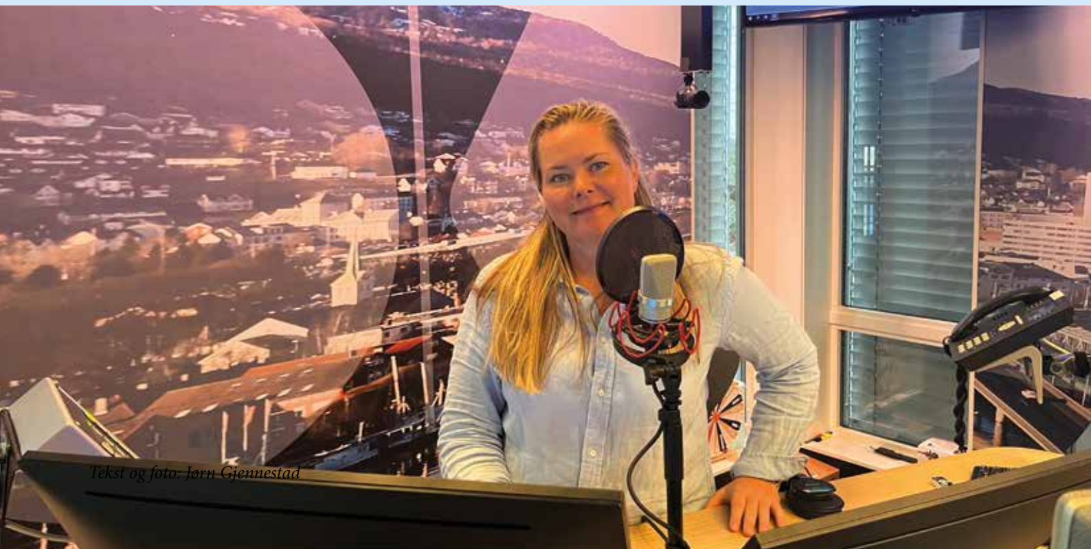
Tekst og foto: Jørn Gjennestad