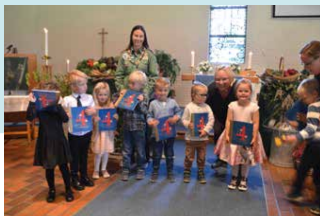
4-årsbok: Stolte barn fra utdelingen i 2019

Oppstart til høsten er fastsatt til mandag 5. september. Men en ting er sikkert; utdeling av 4-årsbok og Helt førsteklassens gjennomføres som vanlig. Og foreldre blir invitert direkte når disse familiegudstjenestene blir satt opp.