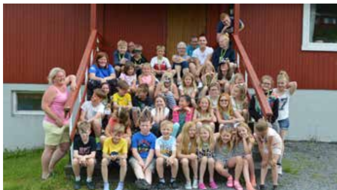
Fra en tidligere agentleir

Det vakre stedet Solsetra ved Hagatjern drives av Norsk Misjonsselskap (NMSU). Ett av de store høydepunktene de inviterer til er agentleir for barn på 2. – 4. trinn (8 - 10 år). En weekend med overnatting, sosiale samlinger, bading (for de tøffe) og spennende agentoppgaver er noe av det som står på programmet. Barn i Mjøndalen menighet bør absolutt melde seg på.