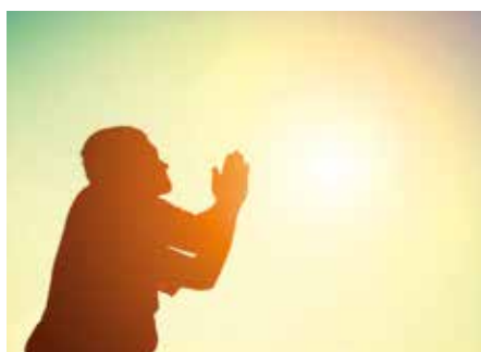
Påske – håp eller frykt? s 2 og 3